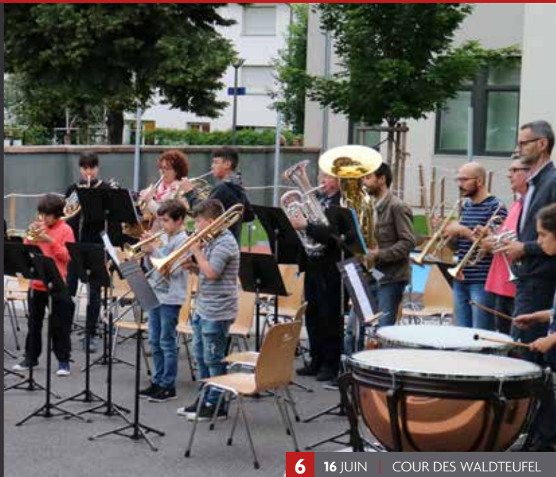
6 16 JUIN | COUR DES WALDTEUFEL