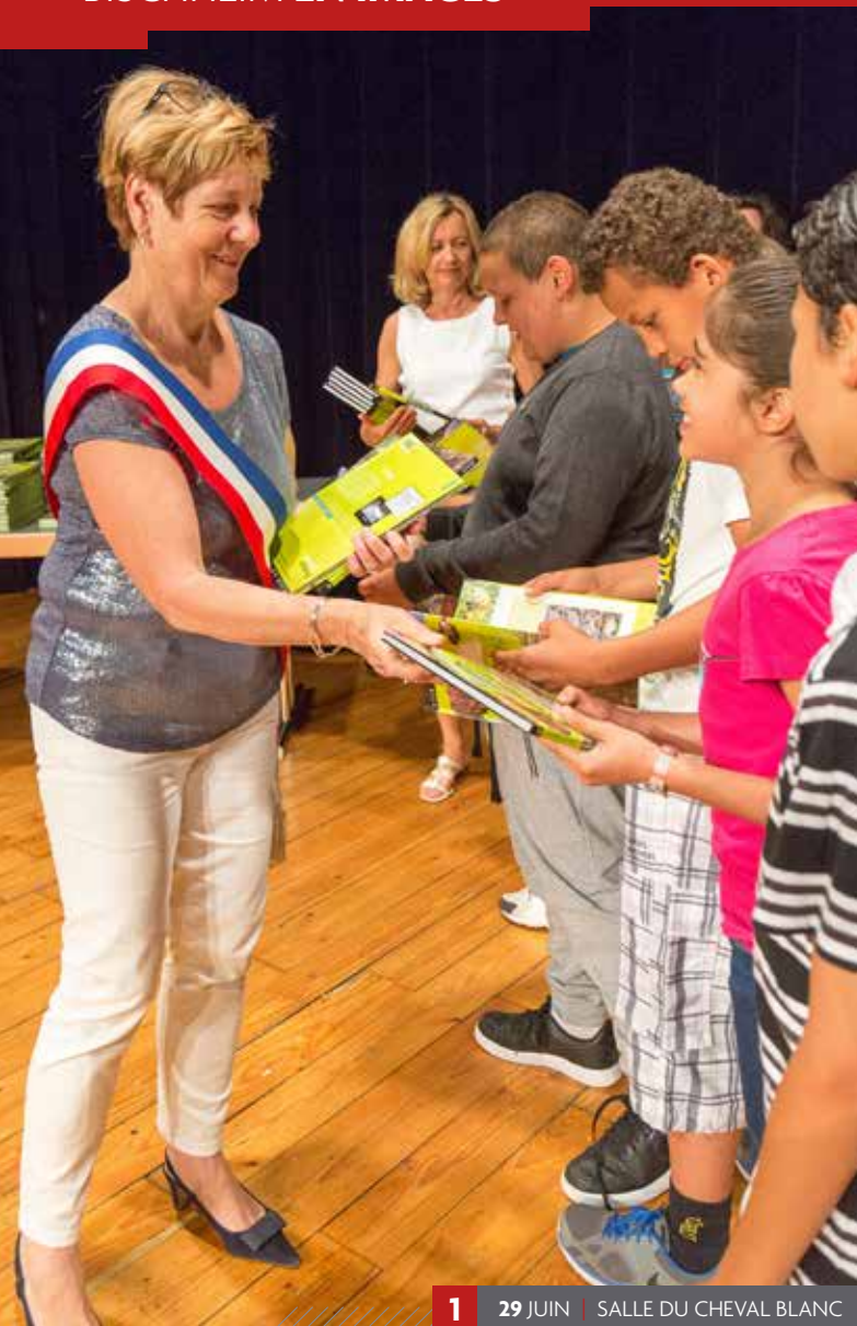
1 29 JUIN | SALLE DU CHEVAL BLANC