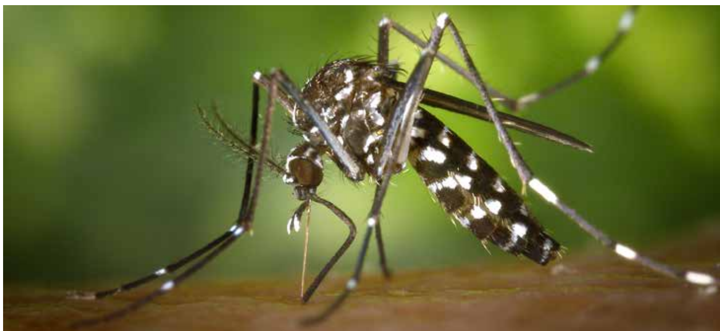
James Guthrie - OXC

Le moustique tigre ou Aedes albopictus est présent dans le Bas-Rhin où un plan de lutte a été mis en place par le département. La ville de Bischheim fait partie des communes mises sous surveillance mais pas de panique, la présence de ce moustique n'est pas synonyme de maladie. Le plan de lutte vise avant tout à éviter sa prolifération.