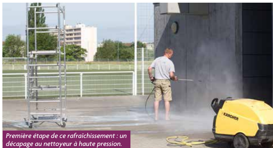
Première étape de ce rafraîchissement : un décapage au nettoyeur à haute pression.