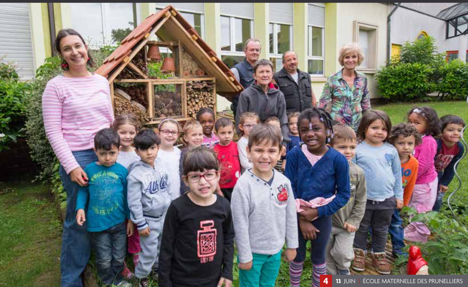
4 13 JUIN | ÉCOLE MATERNELLE DES PRUNELLERS