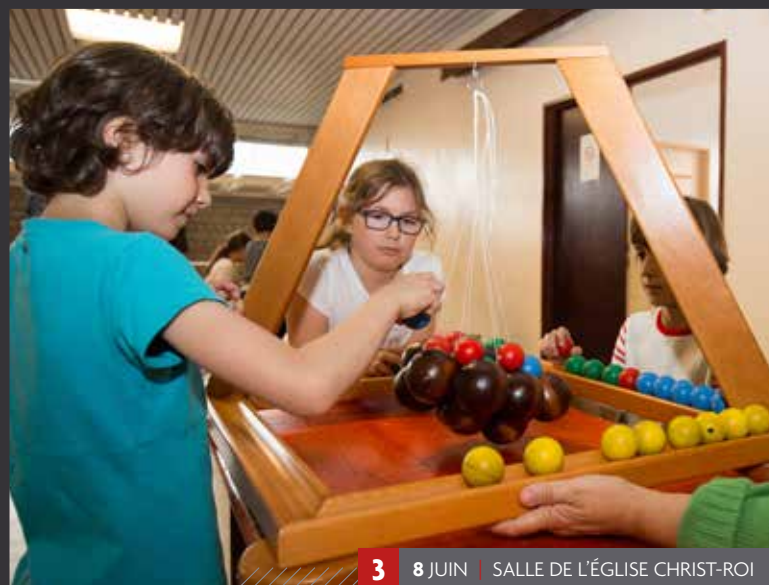
3 8 JUIN | SALLE DE L'ÉGLISE CHRIST-ROI