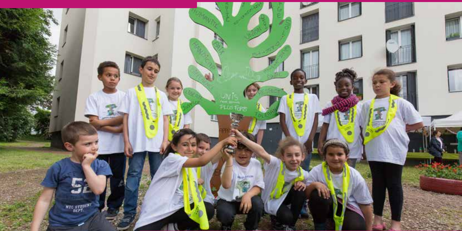
Entre les plantations, un arbre symbolique que les enfants ont décoré des messages qu'ils souhaitent partager.