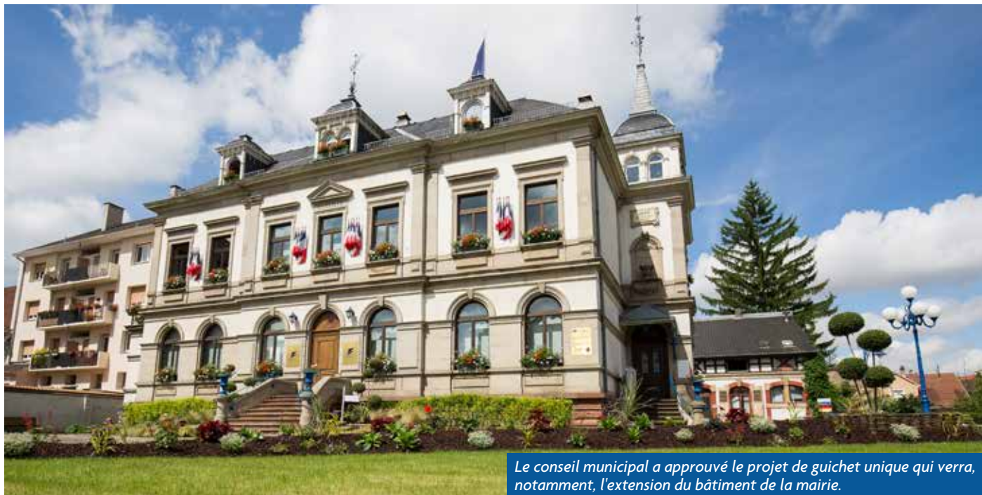
Le conseil municipal a approuvé le projet de guichet unique qui verra, notamment, l'extension du bâtiment de la mairie.