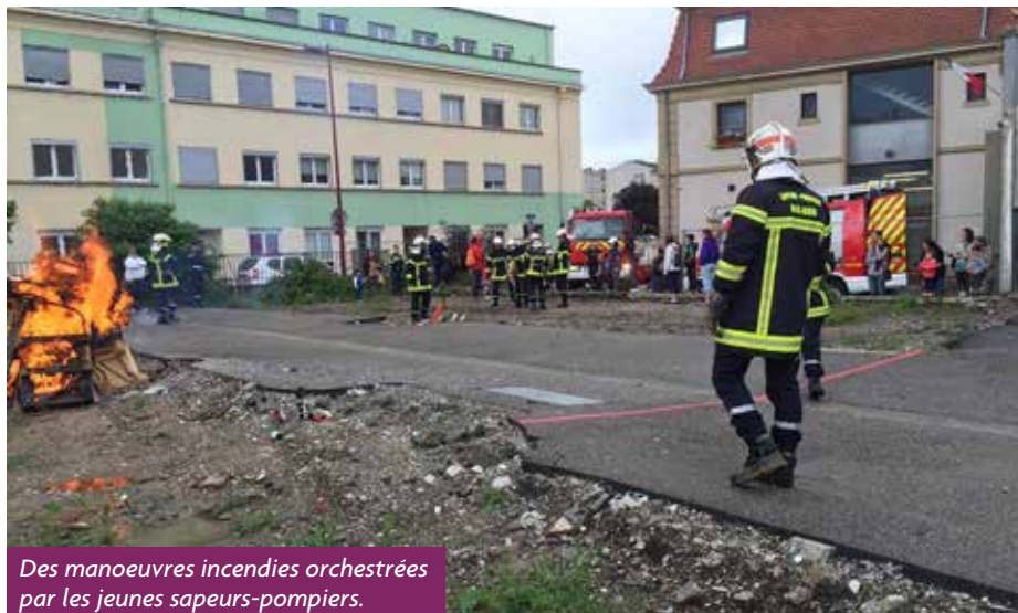
Des manoeuvres incendies orchestrées par les jeunes sapeurs-pompiers.

Accueillis par une vingtaine de pompiers, prompts à répondre à toutes leurs questions, ils ont pu assister à une démonstration des jeunes sapeurs-pompiers (la caserne en compte une quinzaine) en situation d'incendie. Des