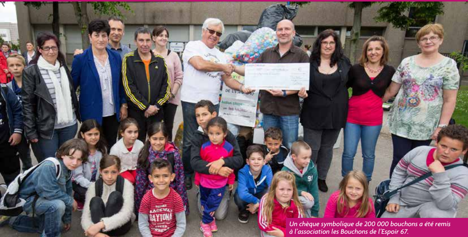
Un chèque symbolique de 200 000 bouchons a été remis à l'association les Bouchons de l'Espoir 67.