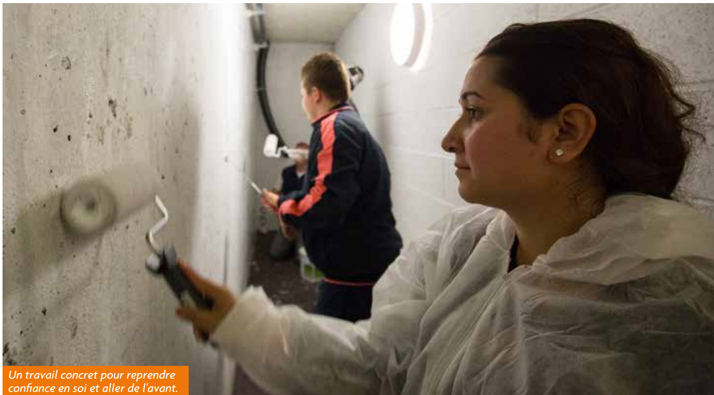
Un travail concret pour reprendre confiance en soi et aller de l'avant.

Du 6 au 17 juin, 4 jeunes ont repeint les caves du N°10 rue Châteaubriand aux Écrivains dans le cadre d'un chantier éducatif organisé par la JEEP (Jeunes Équipes d'Éducation Populaire) pour le bailleur OPUS 67. Une première qui pourrait être renouvelée par le bailleur dans les immeubles réhabilités du quartier.