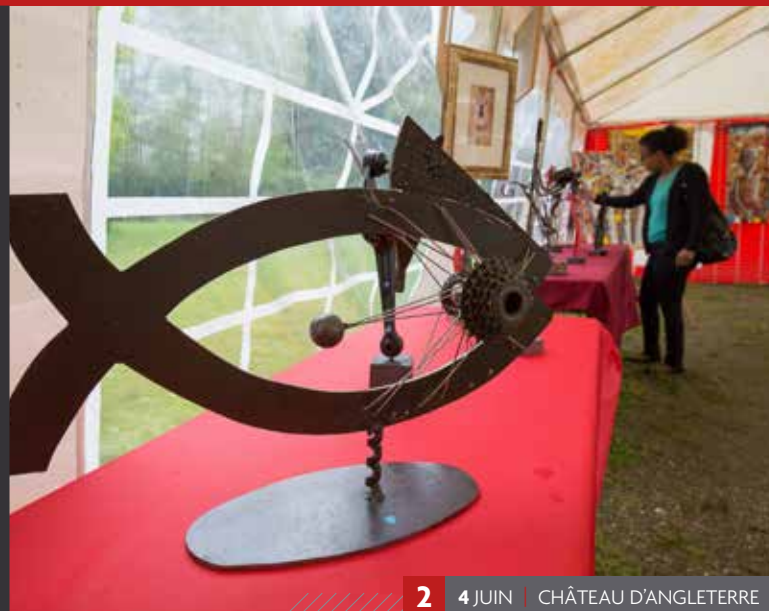
2 4 JUIN | CHÂTEAU D'ANGLETERRE