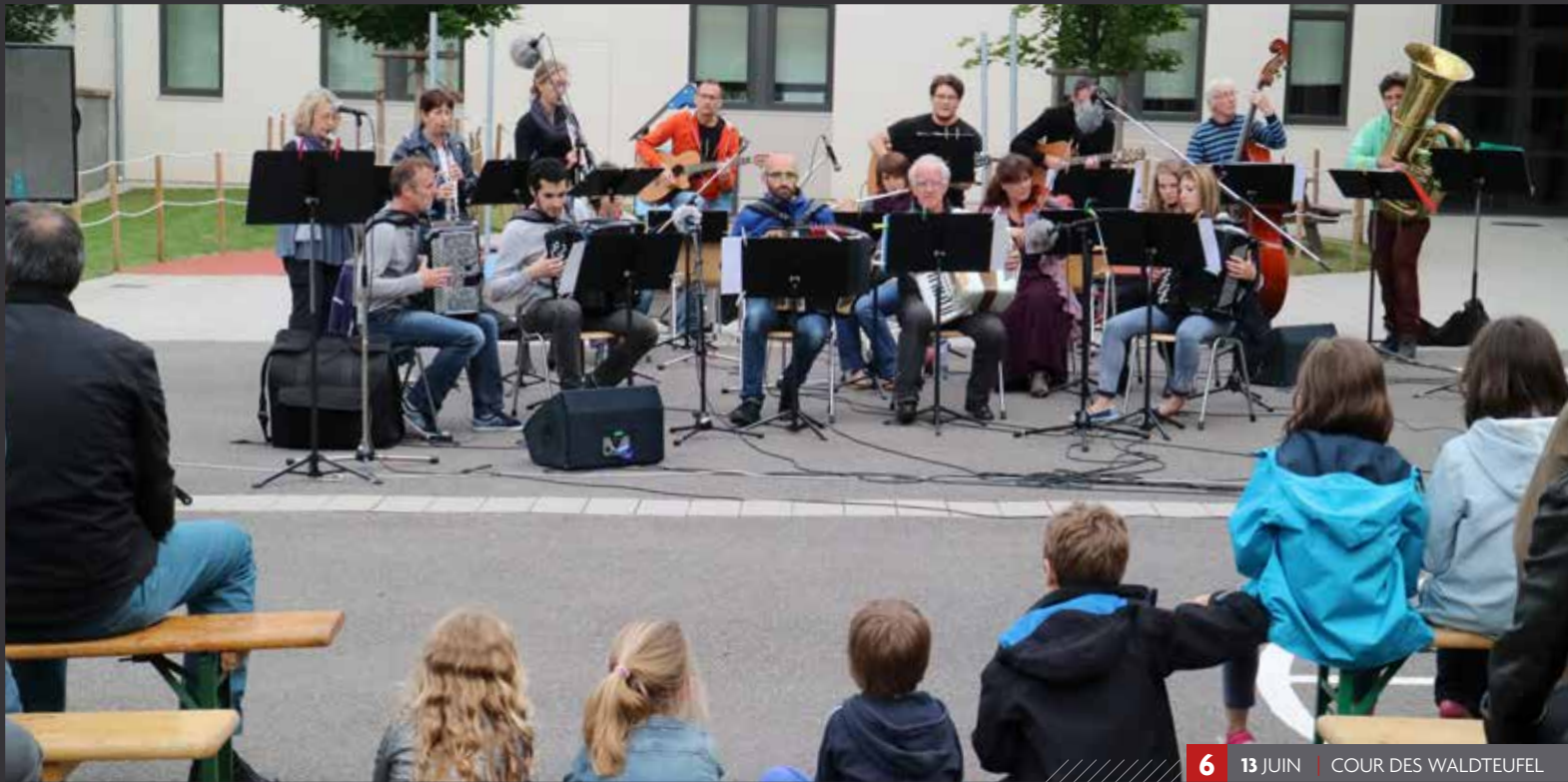
6 13 JUIN | COUR DES WALDTEUFEL