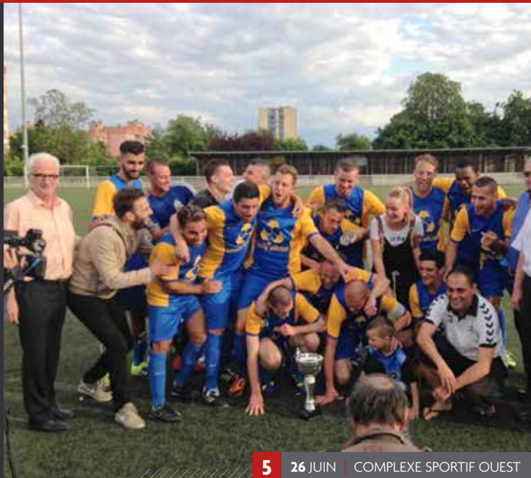
5 26 JUIN | COMPLEXE SPORTIF OUEST