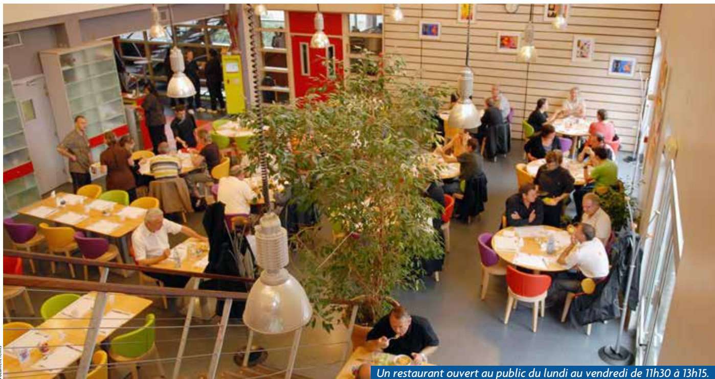
Un restaurant ouvert au public du lundi au vendredi de 11h30 à 13h15.

Le 26 avril dernier, le maire et le conseil municipal accompagnés des administrateurs du centre communal d'action sociale et directeurs de la ville ont déjeuné au restaurant de l'Établissement et Service d'Aide par le Travail (ESAT), anciennement Centre d'Aide par le Travail (CAT) « Anne Claire Staubes » à Schiltigheim.