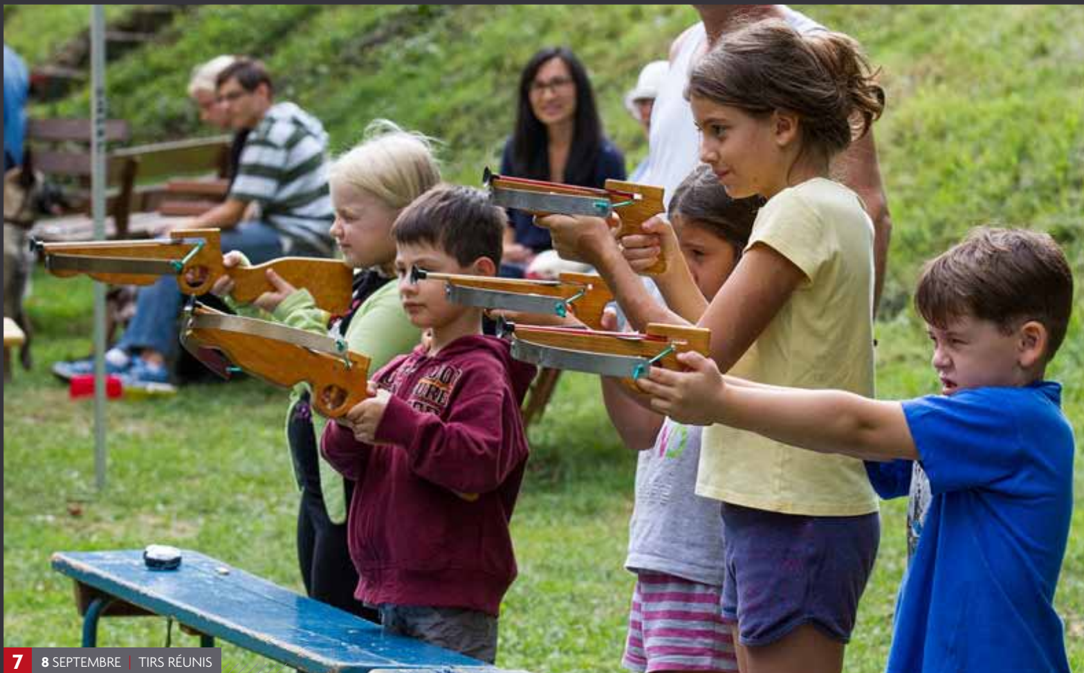
7 8 SEPTEMBRE | TIRS RÉUNIS