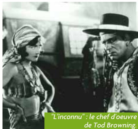
"L'inconnu" : le chef d'œuvre de Tod Browning.