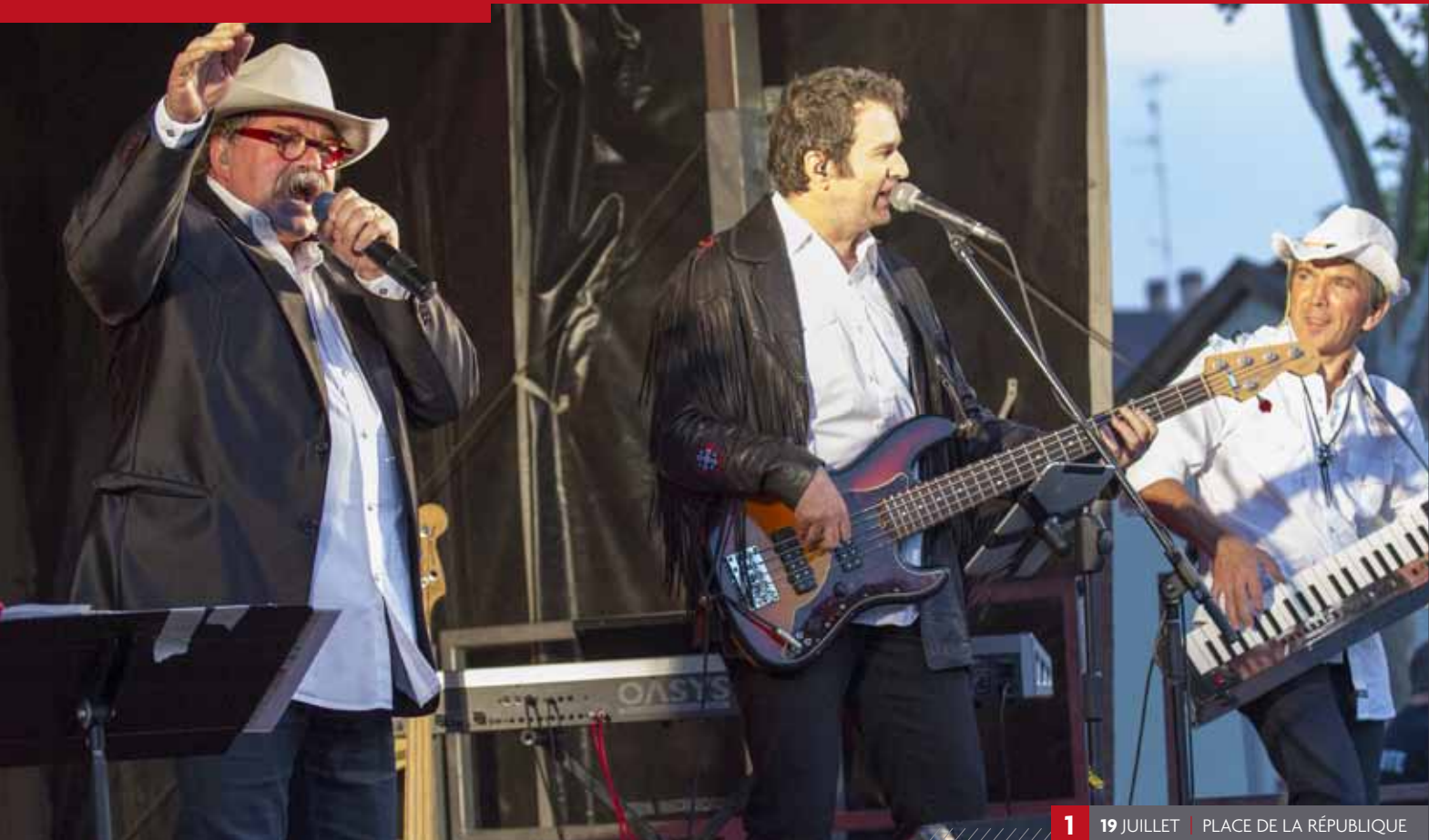
1 19 JUILLET | PLACE DE LA RÉPUBLIQUE