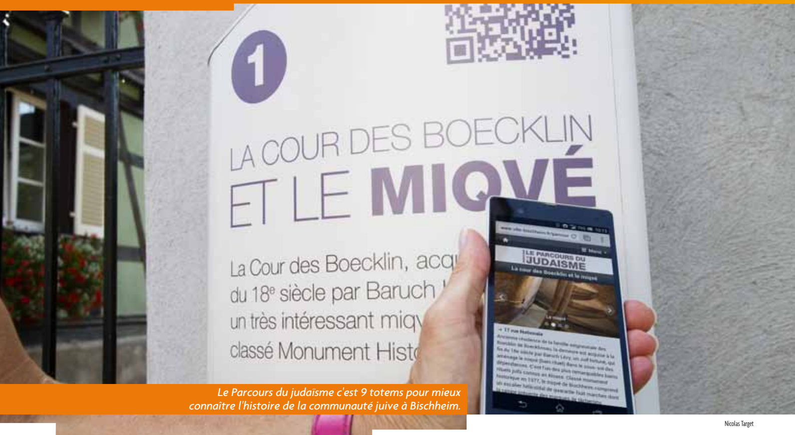
Le Parcours du judaïsme c'est 9 totems pour mieux connaître l'histoire de la communauté juive à Bischheim.