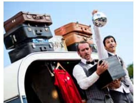
Ne ratez pas la caravane des valises!