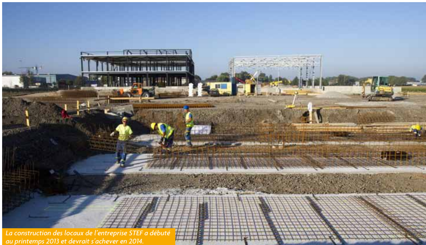
La construction des locaux de l'entreprise STEF a débuté au printemps 2013 et devrait s'achever en 2014.