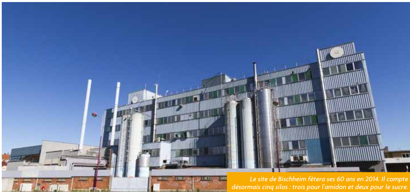
Le site de Bischheim fêtera ses 60 ans en 2014. Il compte désormais cinq silos : trois pour l'amidon et deux pour le sucre.

Qu'y-a-t-il derrière les bâtiments bleus de l'entreprise CSM place de la République ? Encore appelée par nombre de bischheimois « Produits Marguerite », « Bial » ou « BakeMark », l'entreprise a plus de 90 années d'existence. Elle figure aujourd'hui parmi les trois plus grandes entreprises françaises fabricant des ingrédients pour la boulangerie-pâtisserie artisanale et industrielle haut de gamme.