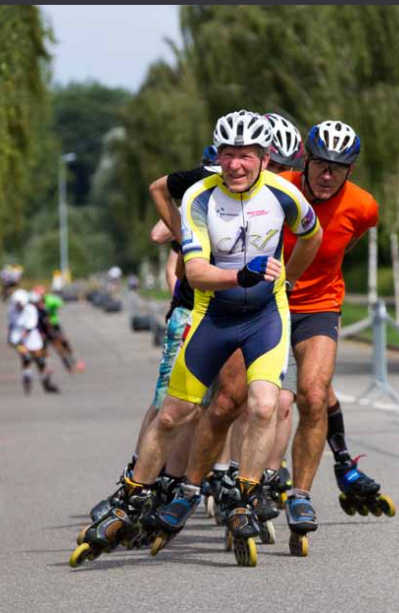
2 8 SEPTEMBRE | ZA BISCHHEIM-HOEHEIM