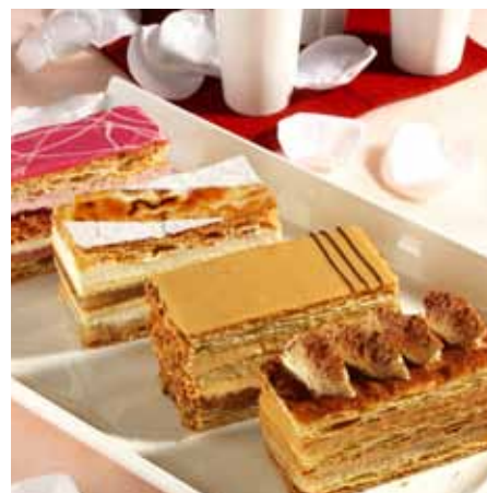
Depuis le 9 septembre et jusqu'au 6 octobre, CSM France organise « le mois du millefeuille ». Fruits rouges, pomme/chocolat, pralin et croquants... Guettez ces nouvelles saveurs chez les pâtisseries participants ( www.lemoisdumillefeuille.com ).

En avril dernier, l'entreprise a investi dans un cinquième silo pour stocker 50 tonnes d'amidon, un ingrédient qui entre dans la composition d'un grand nombre de ses produits. Le silo permettra d'améliorer les conditions de travail en supprimant 20% de la manutention de sacs. Côté environnement, ce seront 20 tonnes de déchets évités et 22 camions de moins chaque année.