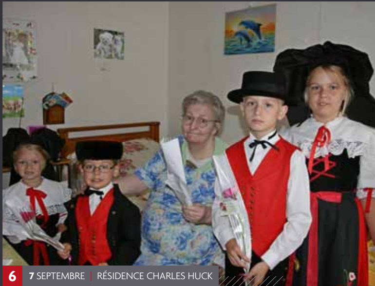
6 7 SEPTEMBRE | RÉSIDENCE CHARLES HUCK

C'est un rendez-vous annuel pour les amateurs de tirs qui peuvent venir s'essayer au tir à la carabine ou à l'arbalète lors de la journée « portes ouvertes » organisée par les Tirs Réunis.