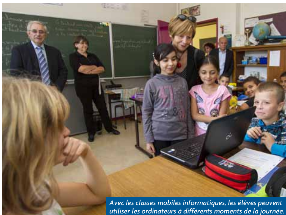
Avec les classes mobiles informatiques, les élèves peuvent utiliser les ordinateurs à différents moments de la journée.

La rentrée scolaire dans les écoles de Bischheim s'est déroulée de façon très classique comme ont pu le constater les élus et l'inspecteur de circonscription Christophe Gleitz lors de leur traditionnelle tournée de rentrée.