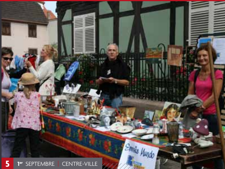
5 1 er SEPTEMBRE | CENTRE-VILLE