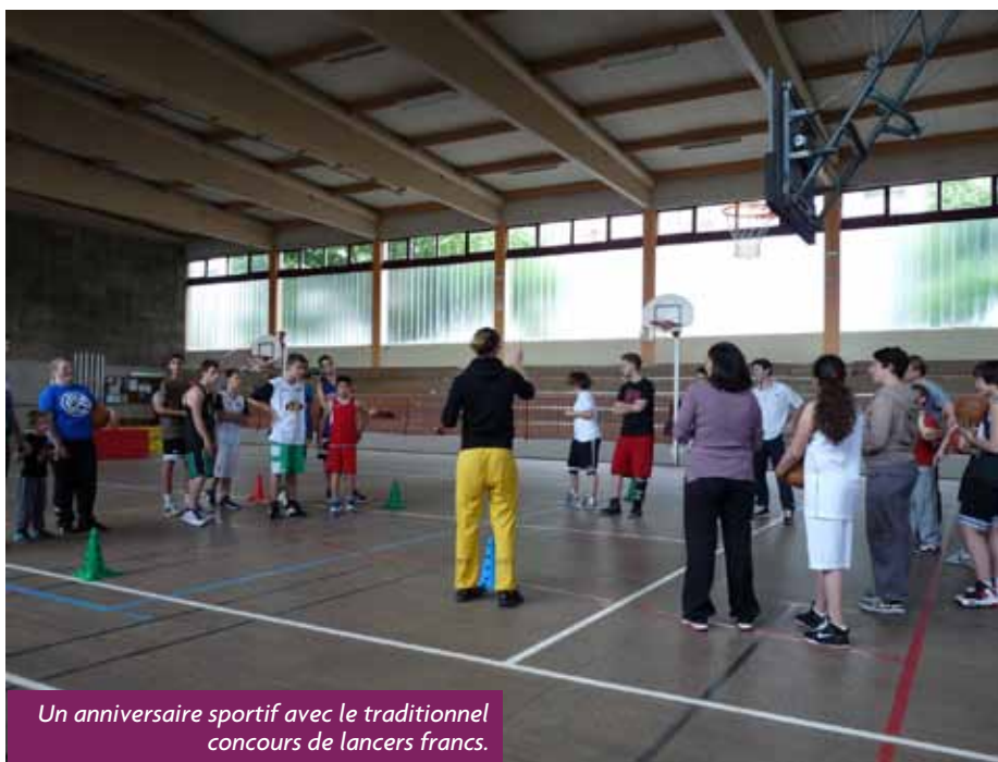
Un anniversaire sportif avec le traditionnel concours de lancers francs.

La rentrée sportive arrive et plusieurs équipes cherchent encore des membres pour compléter les groupes. Vous pouvez écrire à contact.bsbischoheim@orange.fr ou visiter le site du club www.bischoheimbasket.fr