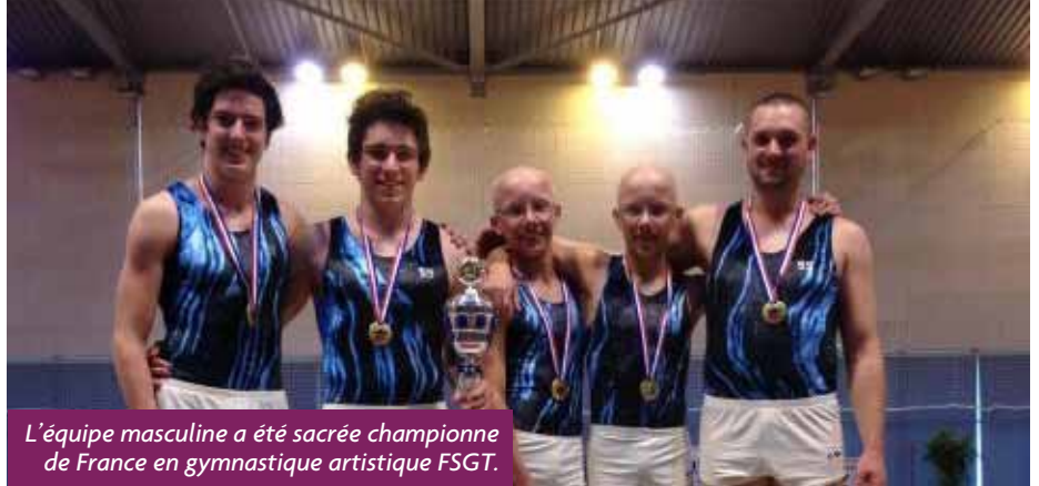
L'équipe masculine a été sacrée championne de France en gymnastique artistique FSGT.

L'équipe masculine de la Liberté a été sacrée championne de France en juin lors des championnats de France de gymnastique artistique FSGT qui se déroulaient à Château Neuf les Martigues.