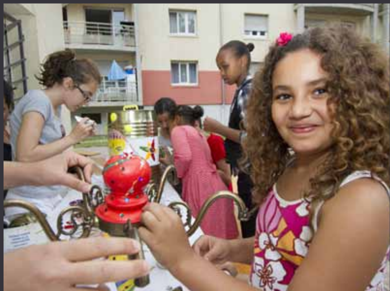
4 17 JUILLET | QUARTIER SNCF