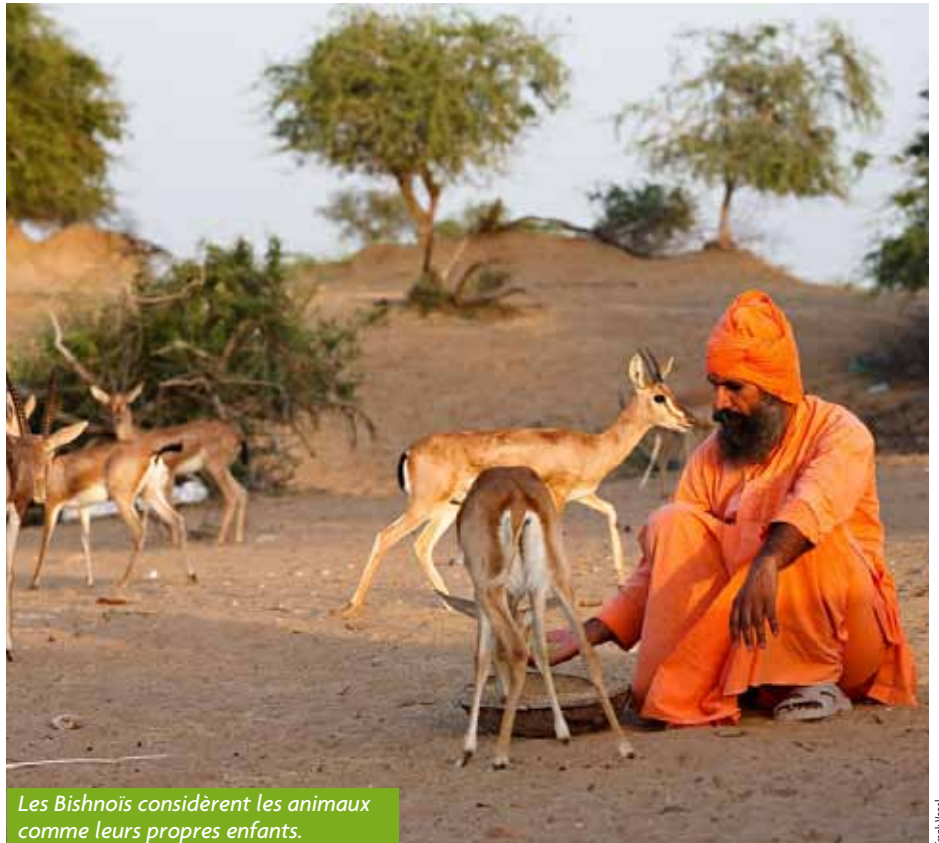
Les Bishnoïs considèrent les animaux comme leurs propres enfants.