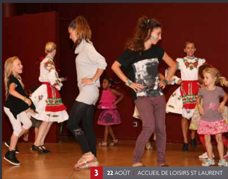
3 22 AOÛT | ACCUEIL DE LOISIRS ST LAURENT