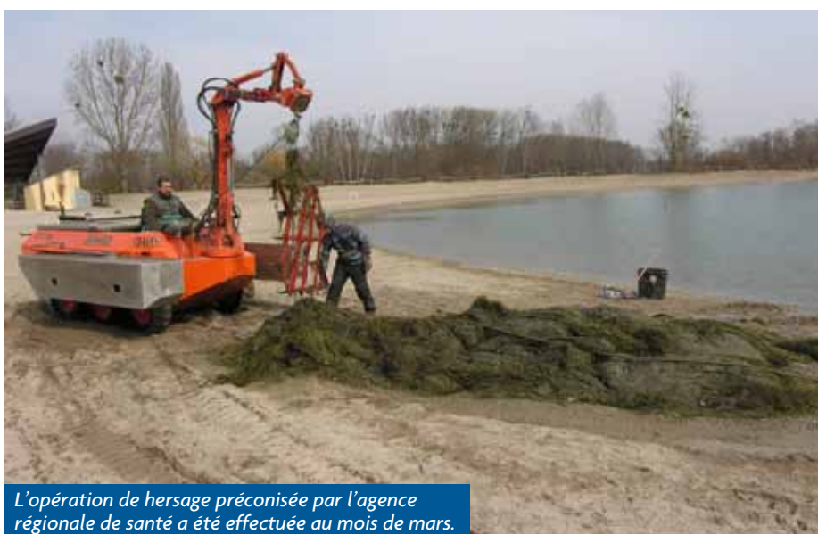
L'opération de hersage préconisée par l'agence régionale de santé a été effectuée au mois de mars.

La surveillance de l'ARS ne se limite pas à la qualité des eaux. Par des contrôles inopinés (le dernier ayant eu lieu le 4 juillet 2012), l'agence veille à l'entretien et aux aménagements en général du site : qualité des sanitaires et des installations du point