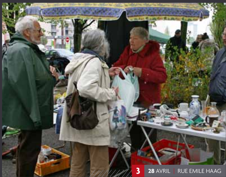
3 28 AVRIL | RUE EMILE HAAG