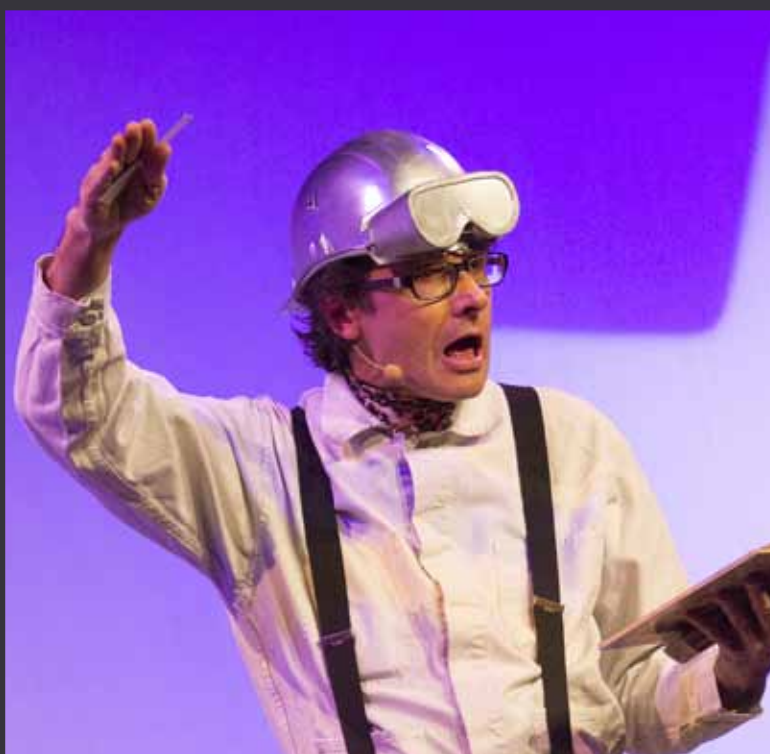
8 12 AVRIL | SALLE DU CERCLE