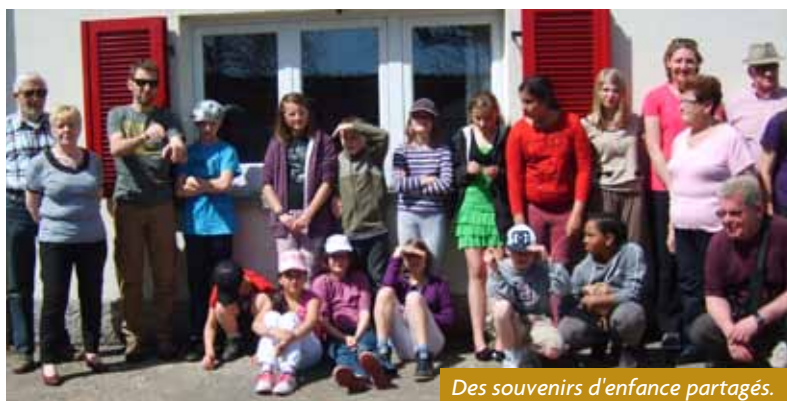
Des souvenirs d'enfance partagés.

Traditionnellement durant les congés scolaires de printemps des enfants de l'accueil de loisirs St Laurent partent en séjour à Fréconrupt.