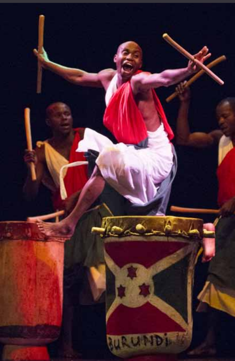
2 17 MAI | SALLE DU CERCLE