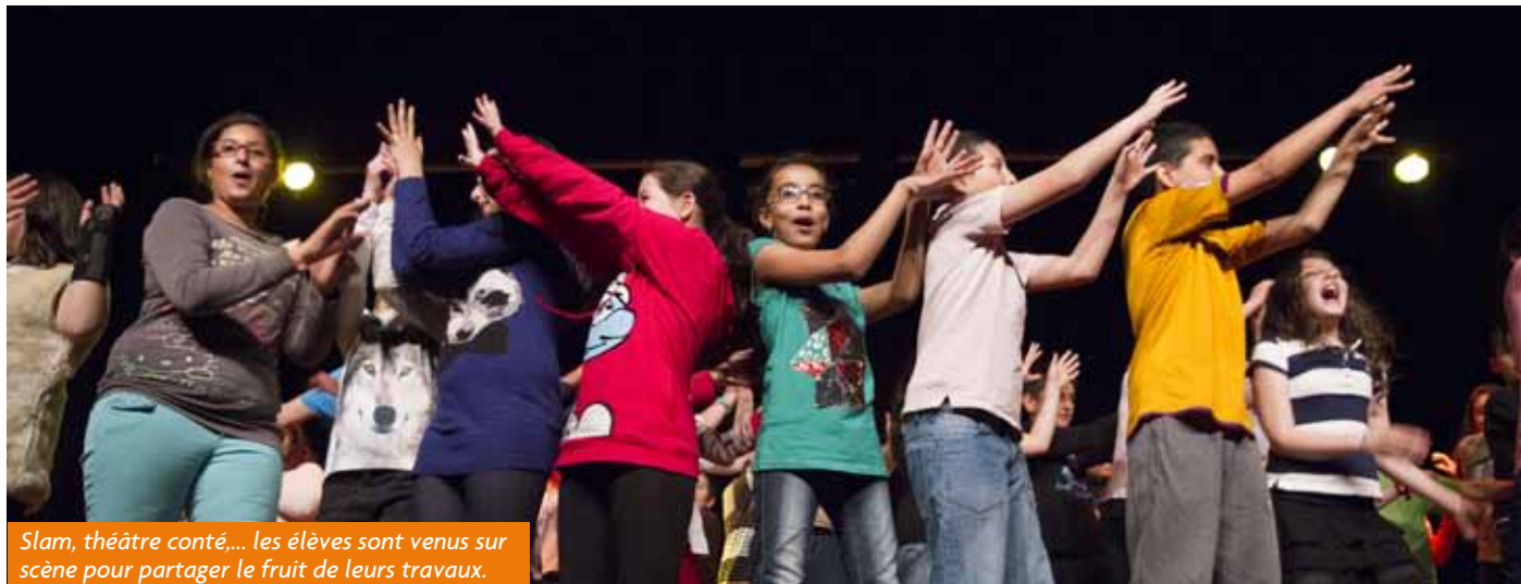
Slam, théâtre conté,... les élèves sont venus sur scène pour partager le fruit de leurs travaux.

Initié et porté par l'association PasSages en partenariat avec l'Education Nationale, les communautés religieuses et la ville de Bischheim, le projet « Respect » a dix ans. Le 16 mai à la salle des Fêtes du Cheval Blanc, les élèves de CM1 et de CM2 des écoles de Bischheim ont une nouvelle fois partagé le fruit de leurs travaux et de leur réflexion sur le thème du « respect ».