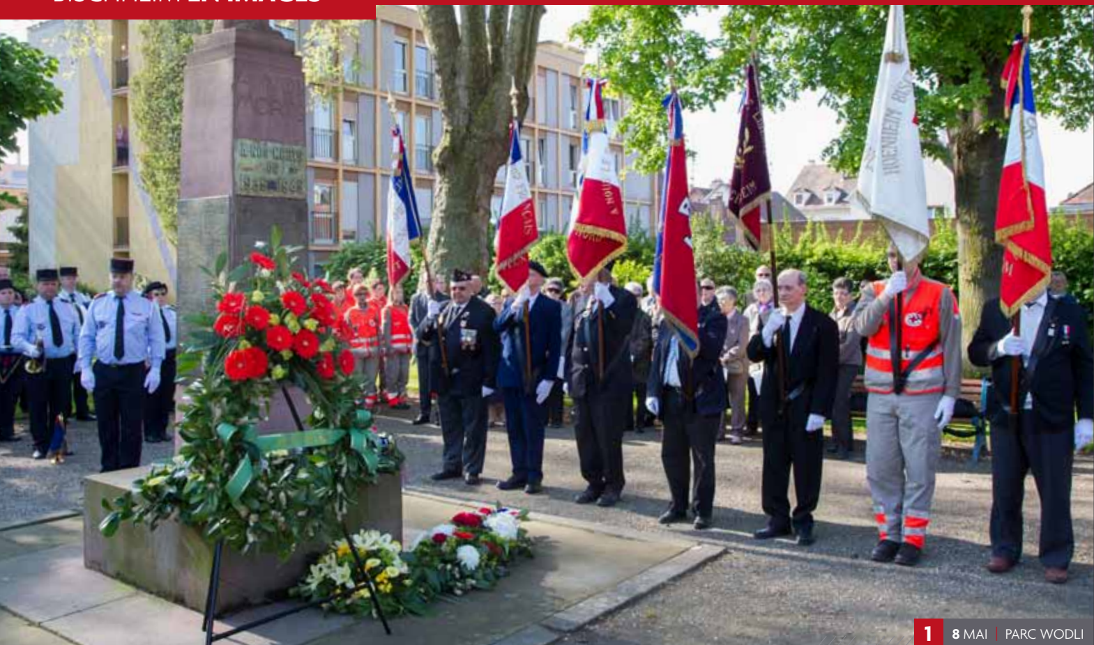
1 8 MAI | PARC WODLI