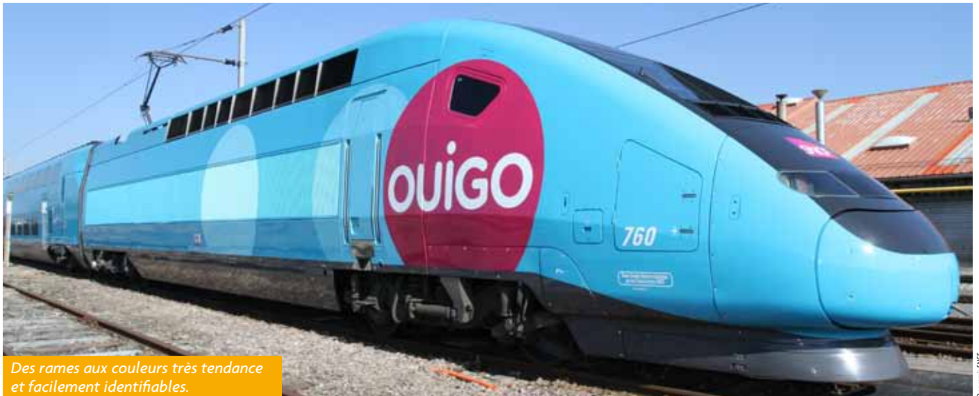
Des rames aux couleurs très tendance et facilement identifiables.

Depuis le 2 avril, la SNCF a mis en service ses nouvelles lignes low cost entre Marne la Vallée et Marseille ou Montpellier. Des rames duplex Ouigo habillées de bleu et rose par les ateliers du Technicentre de Bischheim.