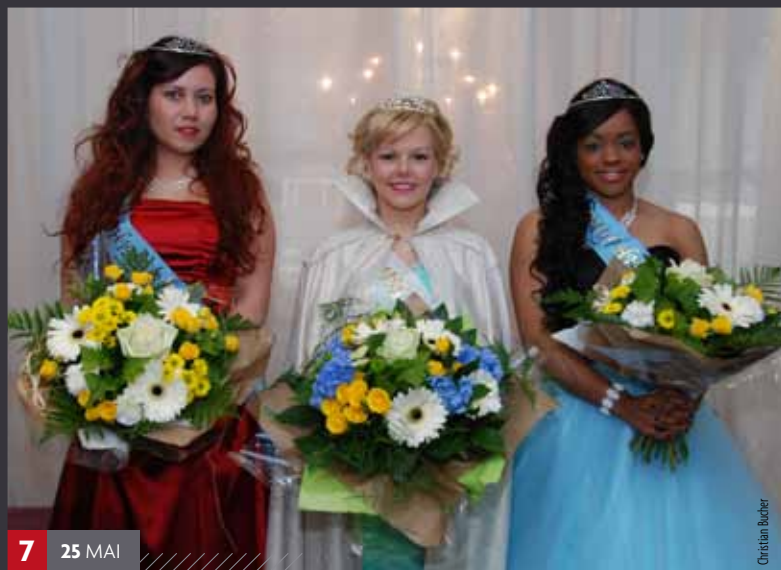
7 25 MAI