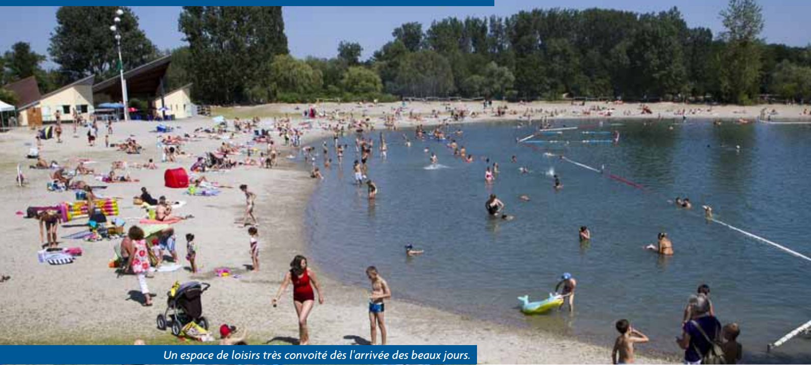
Un espace de loisirs très convoité dès l'arrivée des beaux jours.