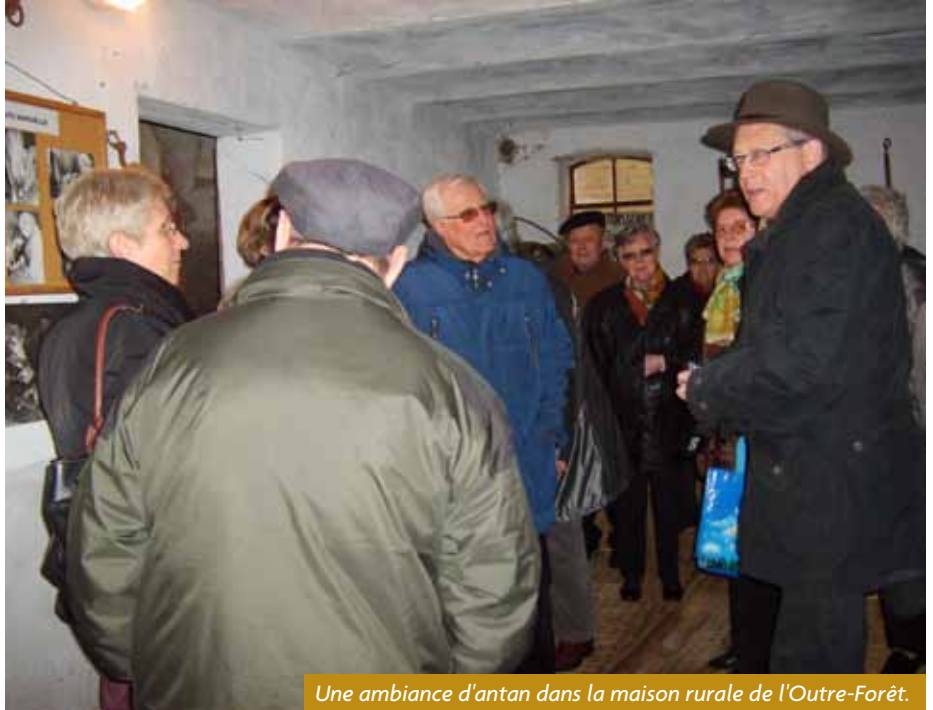
Une ambiance d'antan dans la maison rurale de l'Outre-Forêt.

L'ensemble des participants était ravi de cette journée qui s'est pourtant déroulée sous un ciel très printemps 2013, c'est-à-dire frais et pluvieux.