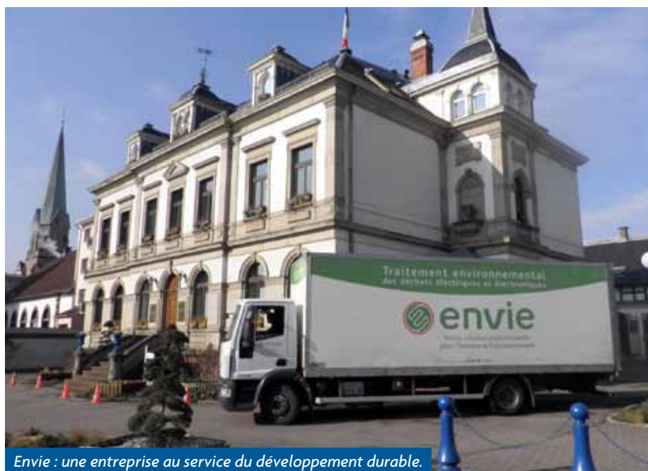
Envie : une entreprise au service du développement durable.

Et pour ceux qui savent bricoler, il est aussi possible d'acheter des pièces détachées d'occasion : moteurs, courroies, clayettes et bacs de réfrigérateurs, paniers de lave-vaisselle, plaques de four, brûleurs de gazinières, tuyaux d'aspirateurs, etc. : la réserve est une vraie caverne d'Ali Baba !