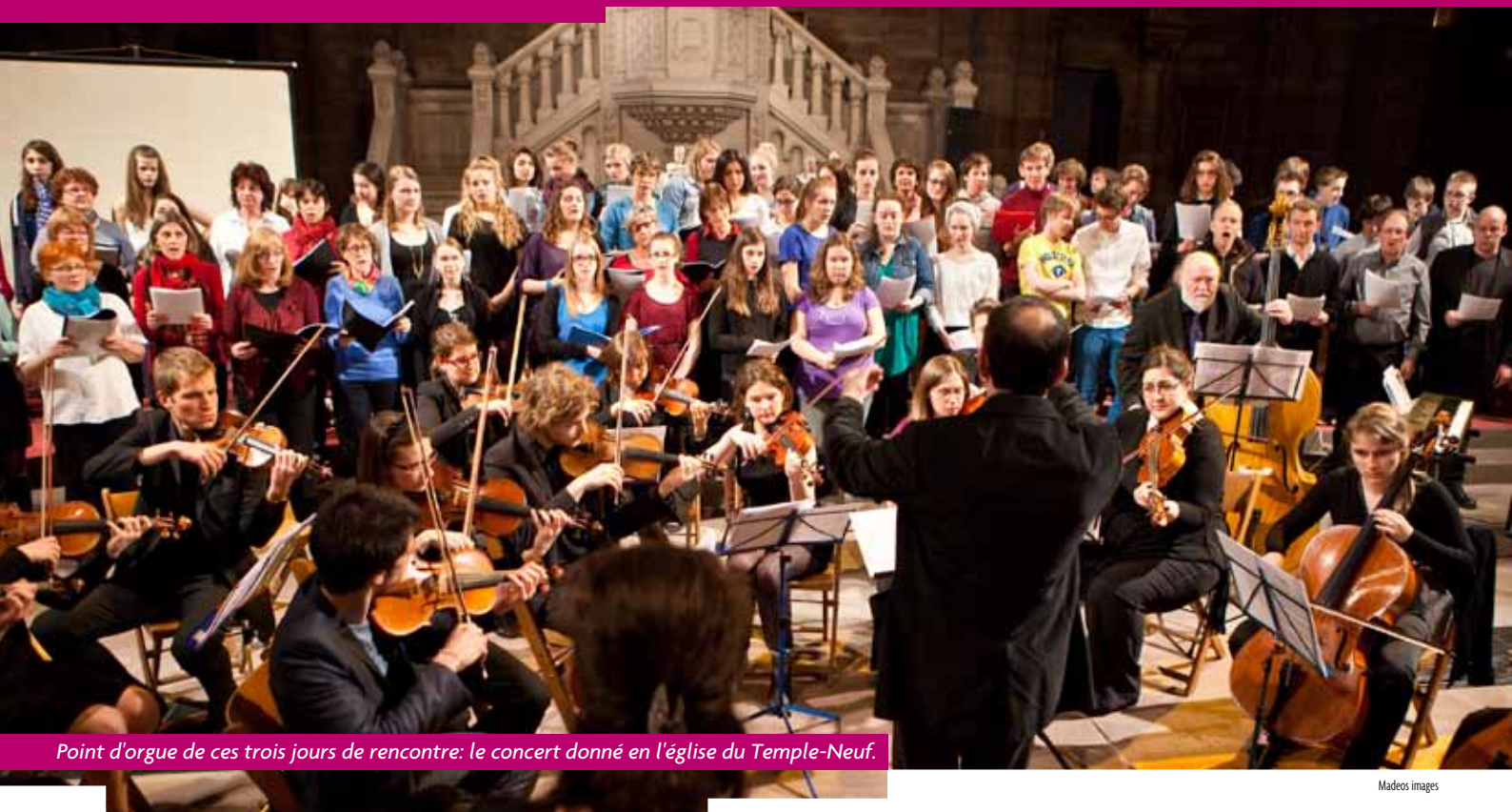
Point d'orgue de ces trois jours de rencontre: le concert donné en l'église du Temple-Neuf.