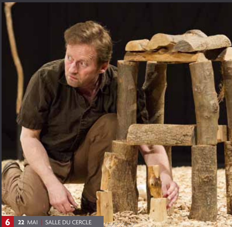
6 22 MAI | SALLE DU CERCLE