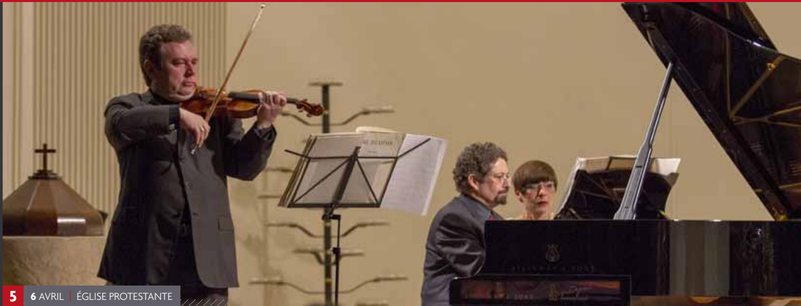
5 6 AVRIL | ÉGLISE PROTESTANTE