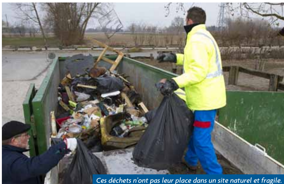
Ces déchets n'ont pas leur place dans un site naturel et fragile.

Malgré un froid vif en ce début de printemps, une cinquantaine de personnes ont répondu au rendez-vous fixé par la ville, le 5 avril, pour le nettoyage du site de la Ballastière.