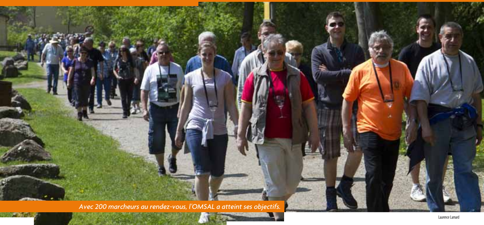
Avec 200 marcheurs au rendez-vous, l'OMSAL a atteint ses objectifs.