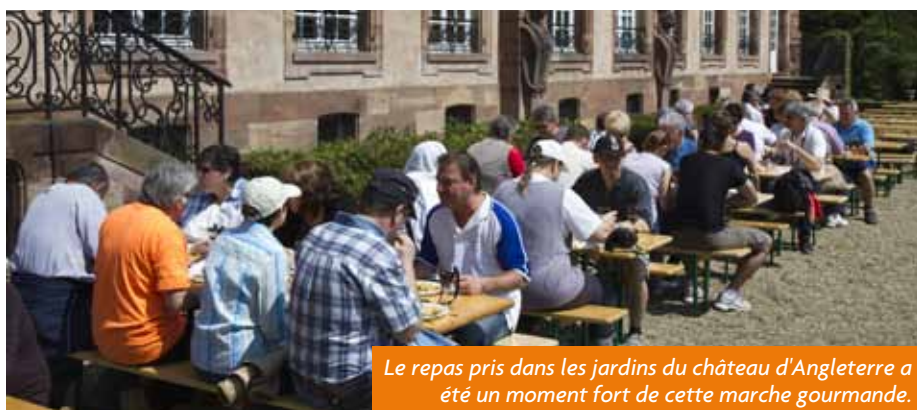
Le repas pris dans les jardins du château d'Angleterre a été un moment fort de cette marche gourmande.