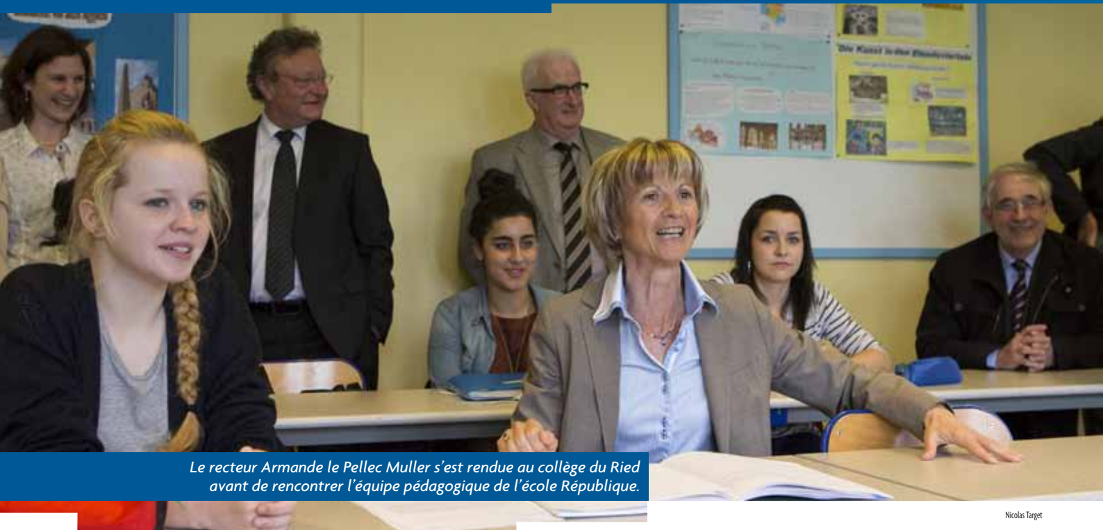
Le recteur Armande le Pellec Muller s'est rendue au collège du Ried avant de rencontrer l'équipe pédagogique de l'école République.