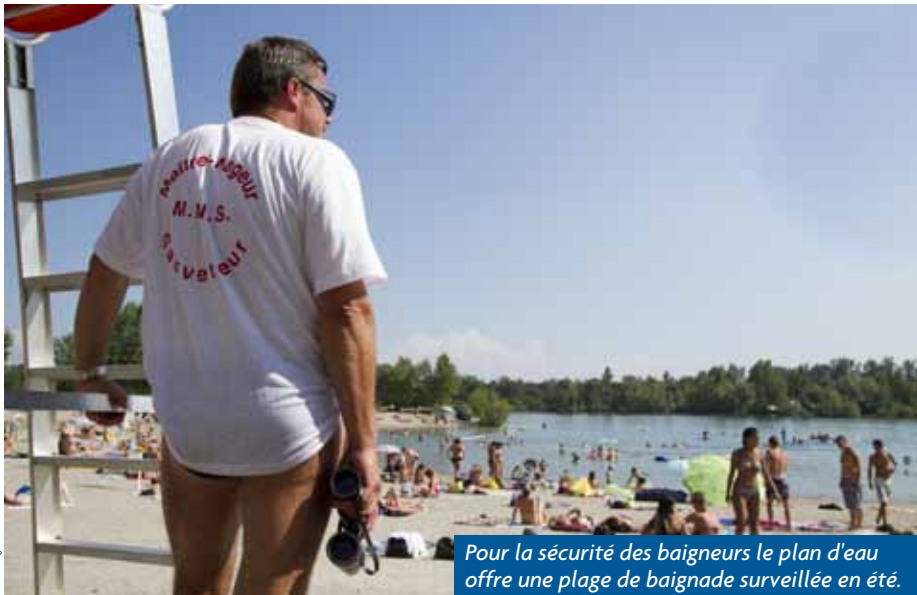
Pour la sécurité des baigneurs le plan d'eau offre une plage de baignade surveillée en été.

des moyens trop agressifs (type produit chimique) pour les éliminer.