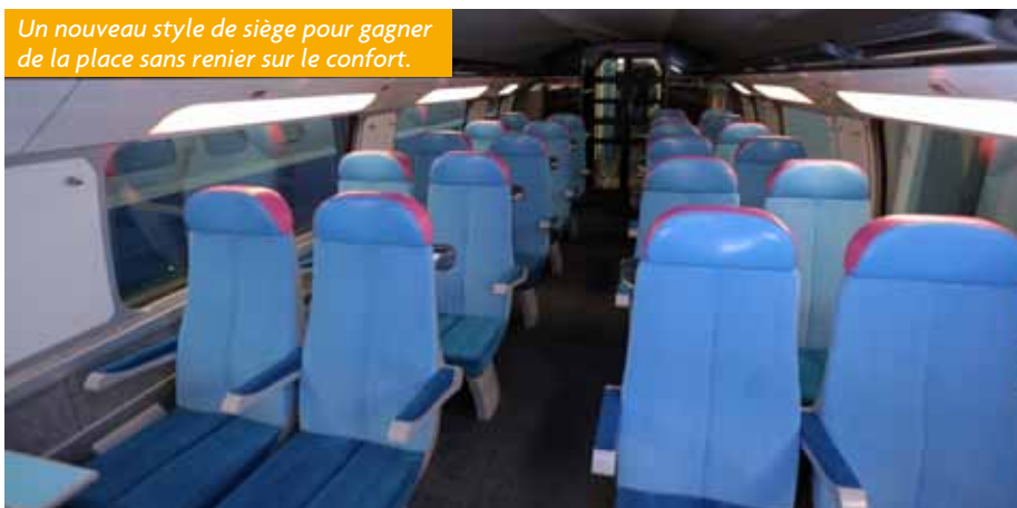
Un nouveau style de siège pour gagner de la place sans renier sur le confort.

Débutée en avril 2012, la transformation des 4 rames a été terminée le 25 mars pour une mise en circulation le 2 avril. Des rames aux couleurs bleu et rose très tendance « au confort au moins équivalent à celui des rames traditionnelles et répondant aux normes de sécurité en vigueur » assure la SNCF qui, par cette stratégie, se prépare à l'ouverture des lignes à la concurrence en 2019.