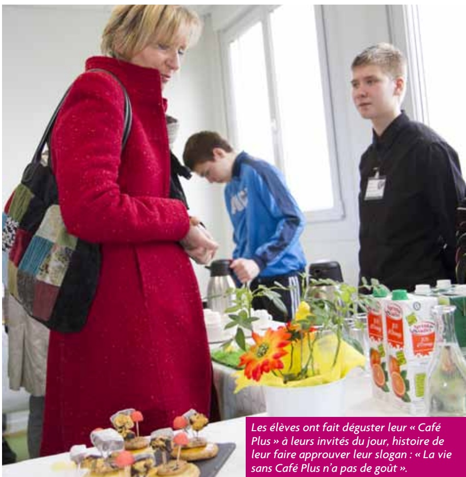
Les élèves ont fait déguster leur « Café Plus » à leurs invités du jour, histoire de leur faire approuver leur slogan : « La vie sans Café Plus n'a pas de goût ».

Les projets, mis en place dans ces ateliers, ont l'avantage de les aider à choisir une voie en les mettant concrètement en situation. C'est une première ouverture sur le monde de l'entreprise que certains côtoieront très vite s'ils s'orientent en CAP.