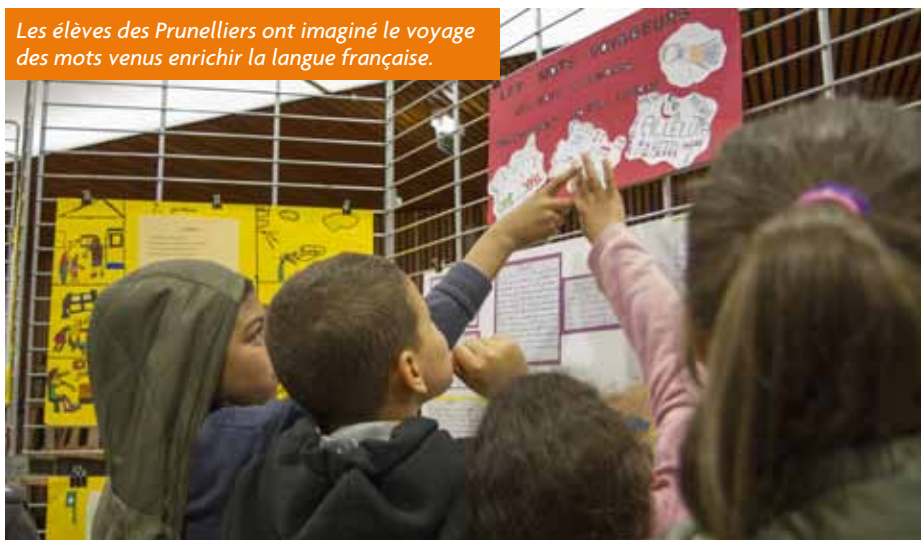
Les élèves des Prunelliers ont imaginé le voyage des mots venus enrichir la langue française.