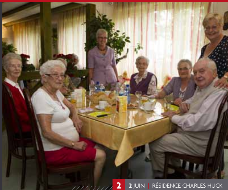
2 2 JUIN | RÉSIDENCE CHARLES HUCK