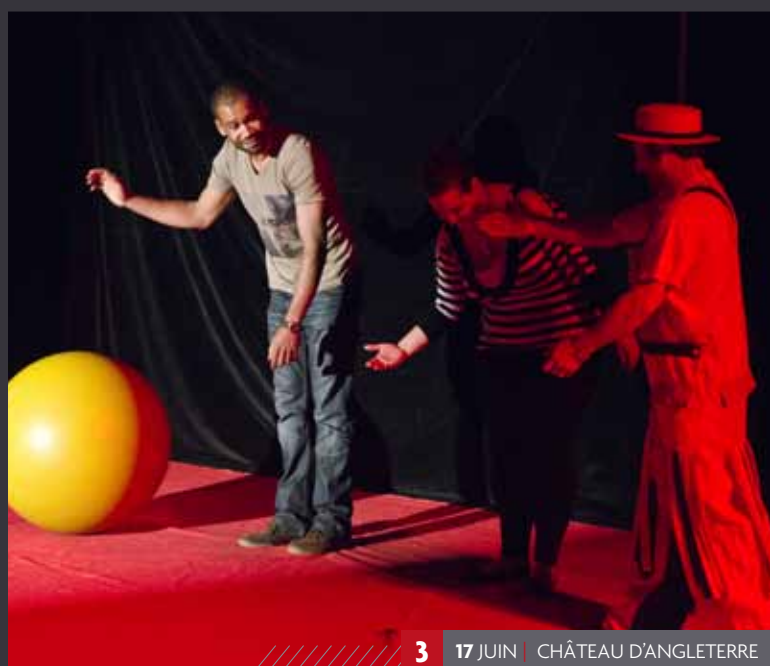
3 17 JUIN | CHÂTEAU D'ANGLETERRE