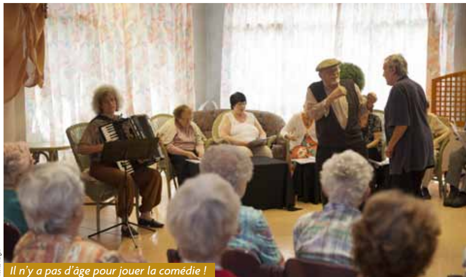
Il n'y a pas d'âge pour jouer la comédie !