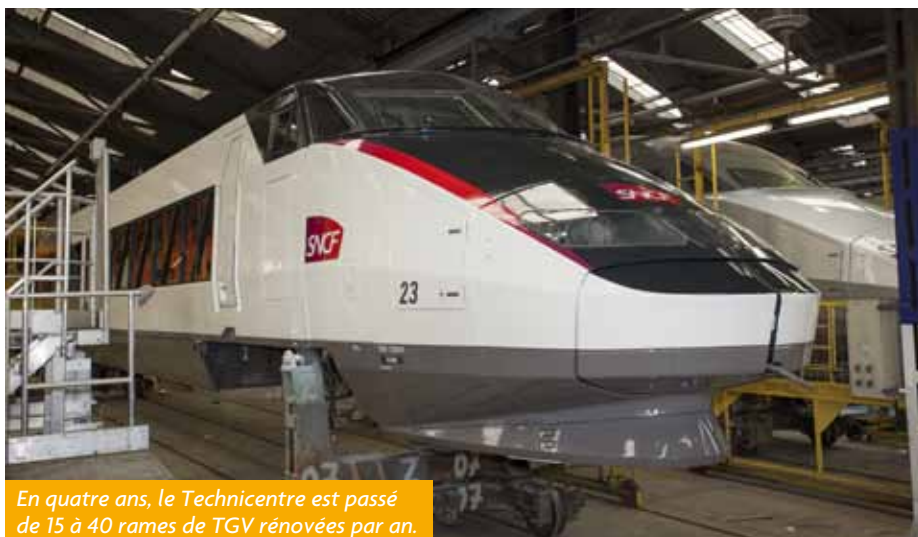
En quatre ans, le Technicentre est passé de 15 à 40 rames de TGV rénovées par an.