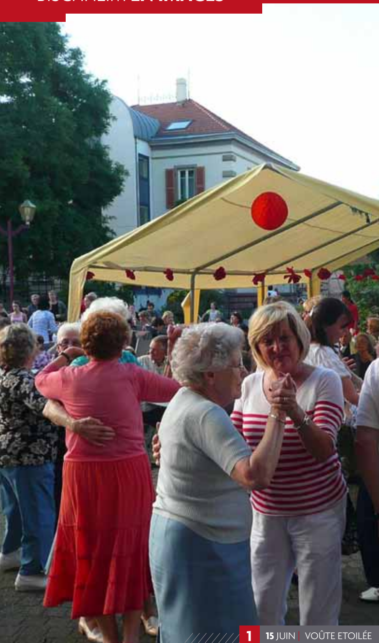
1 15 JUIN | VOÛTE ÉTOILÉE