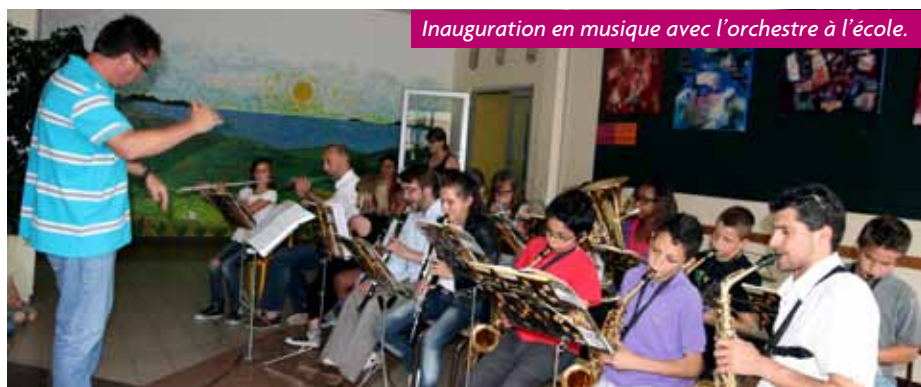
Inauguration en musique avec l'orchestre à l'école.

En quelques mois, la cour de récréation de l'école At Home a pris des couleurs et compte de nouveaux habitants. Les parterres de fleurs plantés par les élèves et leurs enseignants égayent les lieux et, à l'arrière des bâtiments, les premiers insectes ont colonisé la mare. Non loin de là, les plants de tomates et de salades sont sortis de terre dans les bacs en bois du potager pédagogique qui viennent compléter cette zone nature pour laquelle les élèves et les enseignants se sont beaucoup investis. « Sans oublier les conciergers des écoles qui