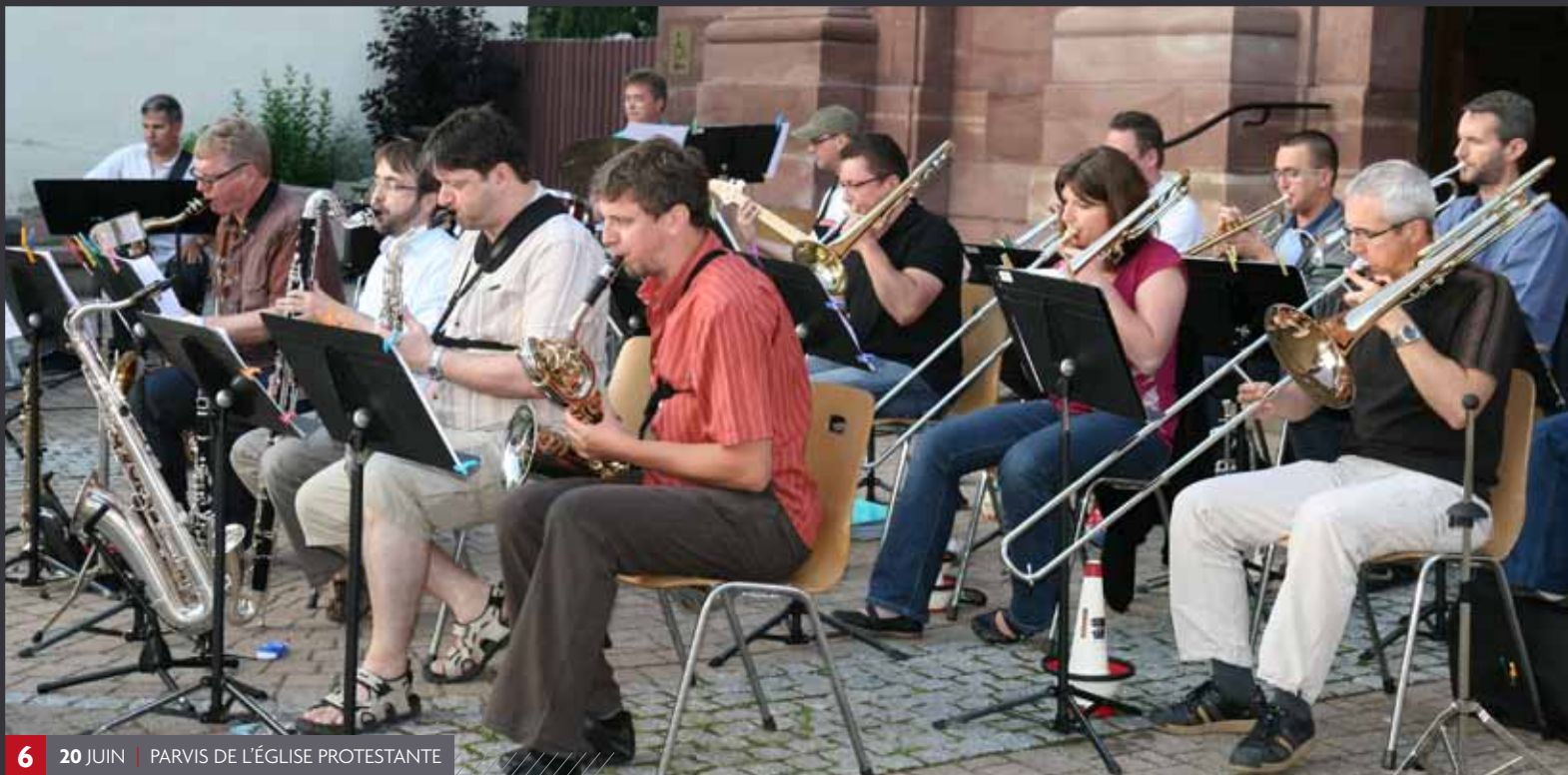
6 20 JUIN | PARVIS DE L'ÉGLISE PROTESTANTE