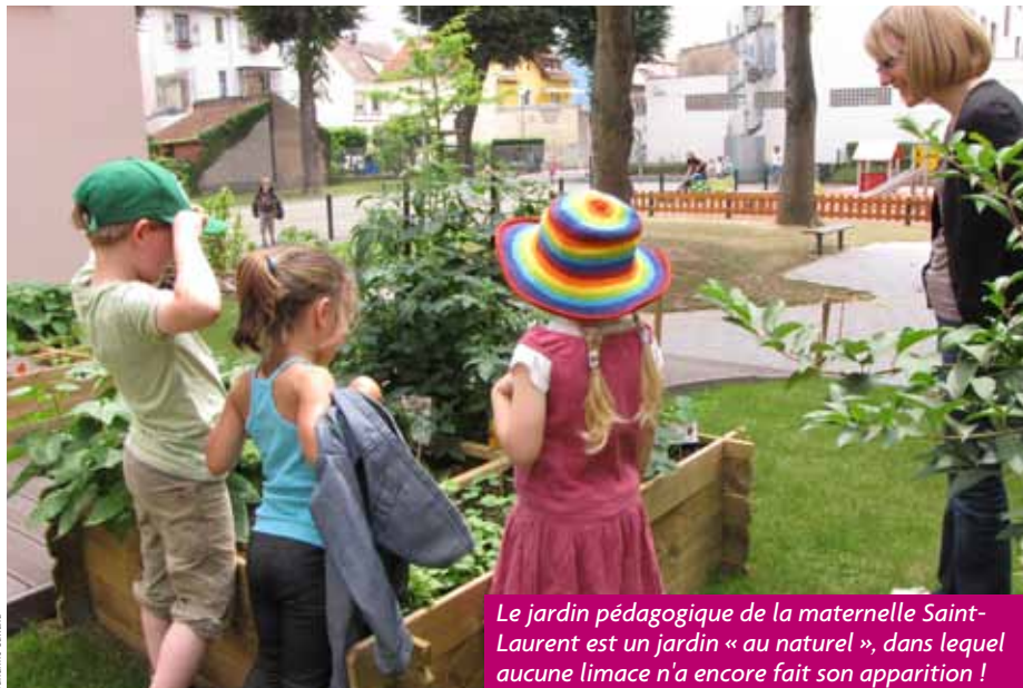
Le jardin pédagogique de la maternelle Saint-Laurent est un jardin « au naturel », dans lequel aucune limace n'a encore fait son apparition !

Niché dans un coin de la cour de récréation de l'école Saint-Laurent, un adorable potager en carrés fleurant bon la menthe exhibe fièrement radis, tomates, haricots et fraises. Il a deux mois d'existence à peine, et il fait déjà la fierté des trois classes de maternelle. C'est le dernier-né des jardins pédagogiques développés ces dernières années par les écoles bischheimois.