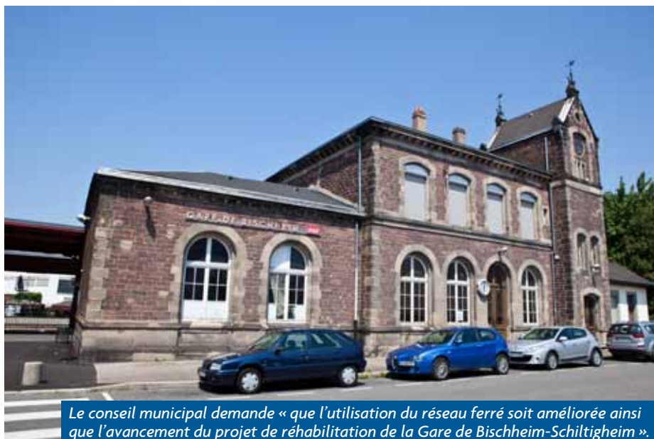
Le conseil municipal demande « que l'utilisation du réseau ferré soit améliorée ainsi que l'avancement du projet de réhabilitation de la Gare de Bischheim-Schiltigheim ».