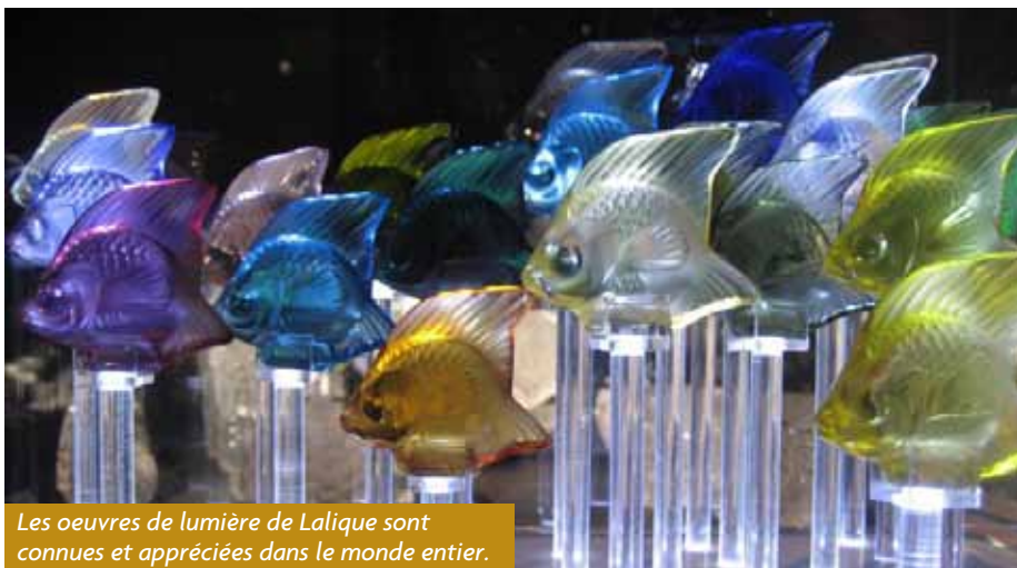
Les œuvres de lumière de Lalique sont connues et appréciées dans le monde entier.

Guidés par des hôtes très érudites, les seniors ont eu l'opportunité de découvrir toutes les facettes de cet artiste de génie que fut René Lalique, qui débuta sa vie professionnelle à Paris comme joaillier. Sa rencontre avec Emile Gallé, grand verrier, l'amena à utiliser des matériaux peu usités dans la bijouterie tels que le verre, l'émail, le cuir, la corne et la nacre. Des flacons de parfum aux bouchons de radiateur pour des grandes marques automobiles, le musée raconte l'histoire de ce verrier qui s'installa tout d'abord à Clairefontaine puis à Combs-la-Ville avant de venir à Wingen-sur-Moder en 1918 (actuellement l'unique site de production de France) pour s'y épanouir, grâce à un environnement forestier et minéral particulièrement favorable. A sa disparition en 1945, son fils démarra le travail du cristal avec des créations exceptionnelles. Aujourd'hui, le groupe Lalique est sous contrôle d'une société Suisse qui perpétue le savoir-faire des Lalique.