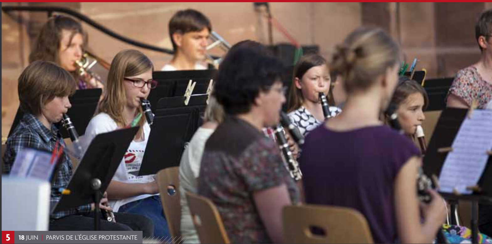
5 18 JUIN | PARVIS DE L'ÉGLISE PROTESTANTE