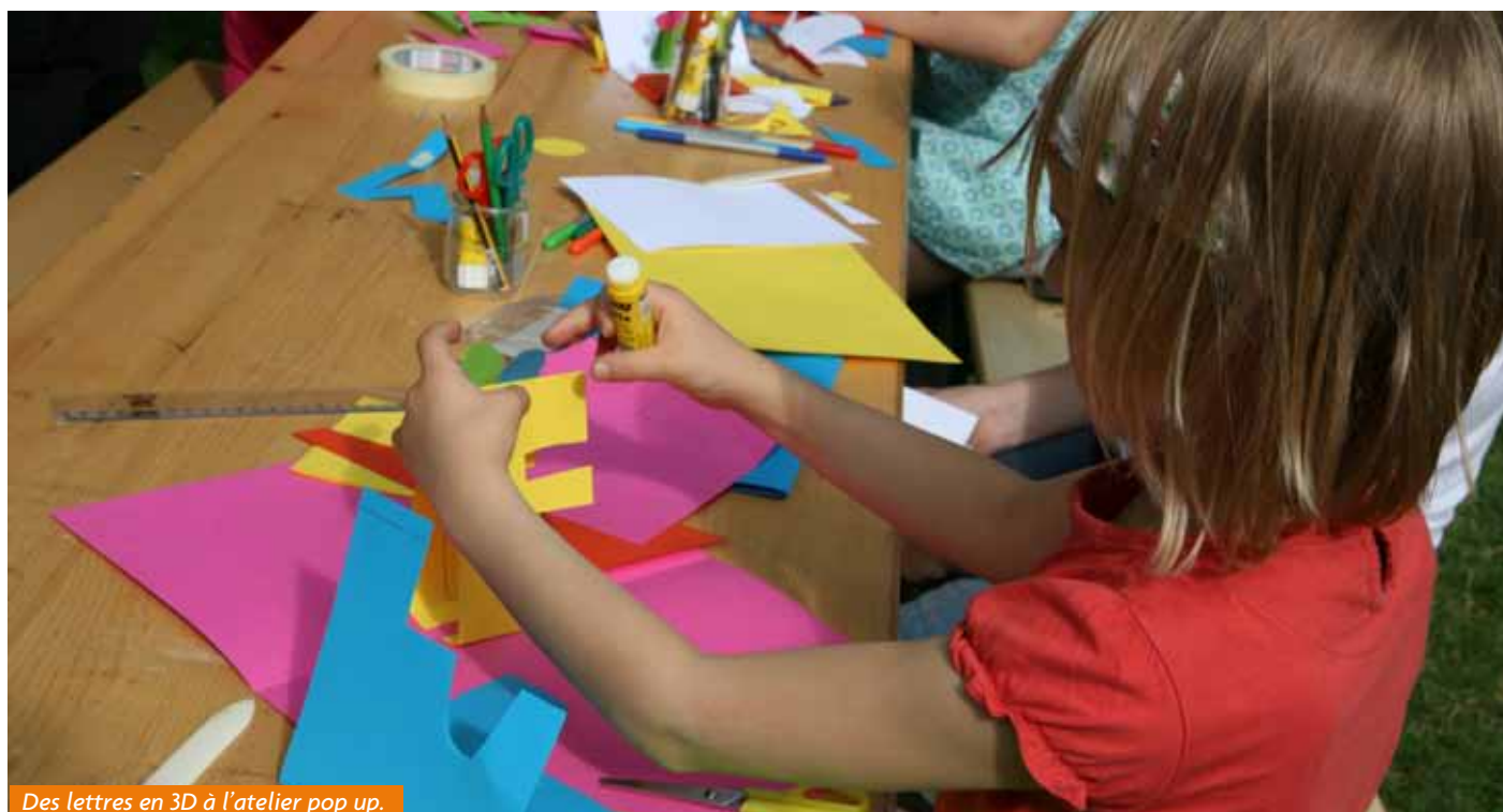
Des lettres en 3D à l'atelier pop up.

C'était « Un dimanche à la bibli », animé et instructif, idéal pour partager un moment agréable en famille.