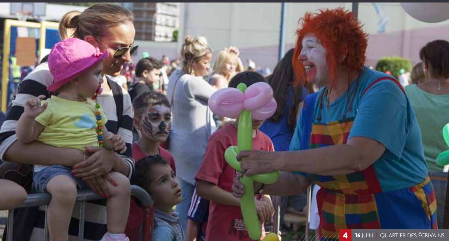
4 16 JUIN | QUARTIER DES ÉCRIVAINS