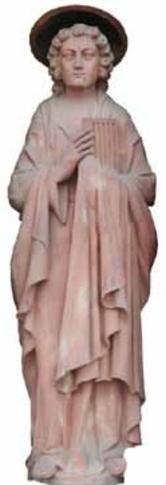
Statue de saint Laurent au-dessus du porche d'entrée portant l'instrument de son supplice réalisée par Adolphe Molz.