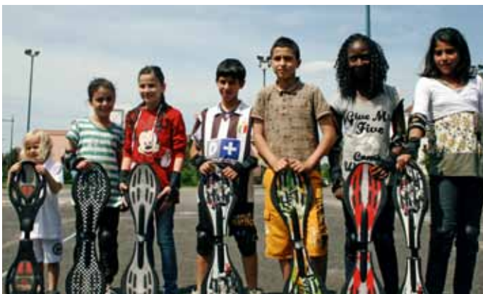
L'espace rencontre du Guirbaden est l'un des trois espaces rencontres ouverts aux jeunes de la ville et géré par le Pôle Jeunesse.

Chargé de l'organisation des temps de loisirs, le Pôle Jeunesse s'inscrit dans la continuité éducative assurée par les parents ou l'école et souhaite apporter sa pierre à l'édifice en contribuant au « mieux vivre ensemble ».