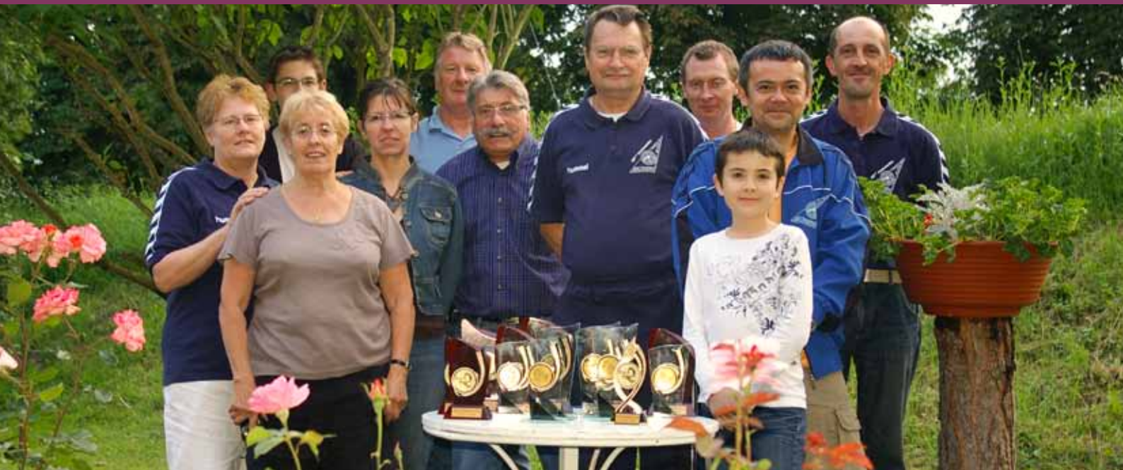
Lors du Championnat fédéral de tir à 10 mètres et à 50 mètres (FSGT) au mois de juin à Ostwald, les tireurs bischheimois ont remporté 14 trophées.