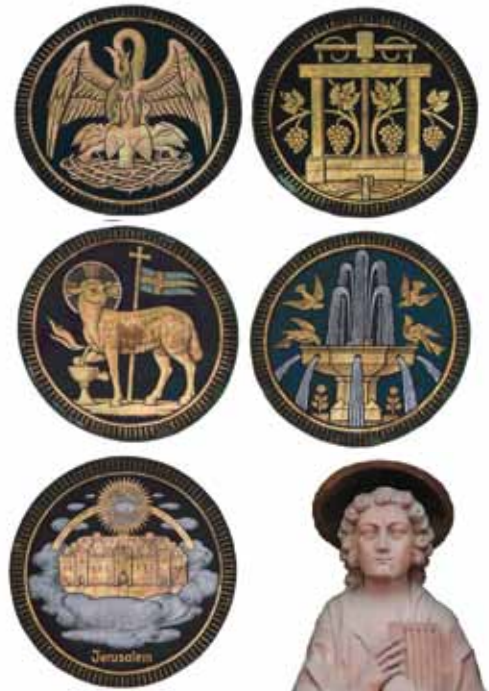
Médaillons du peintre Joseph Asal représentant de gauche à droite et de haut en bas le Pélican, le Pressoir mystique, l'Agnus Dei, la Fontaine d'eau vive et la Jérusalem céleste.

Nous tenons à remercier Jean-Paul Lingelser pour cette collaboration et Gérard Keith qui nous a transmis les photos et les visuels de cette étude consacrée à l'église Saint-Laurent.