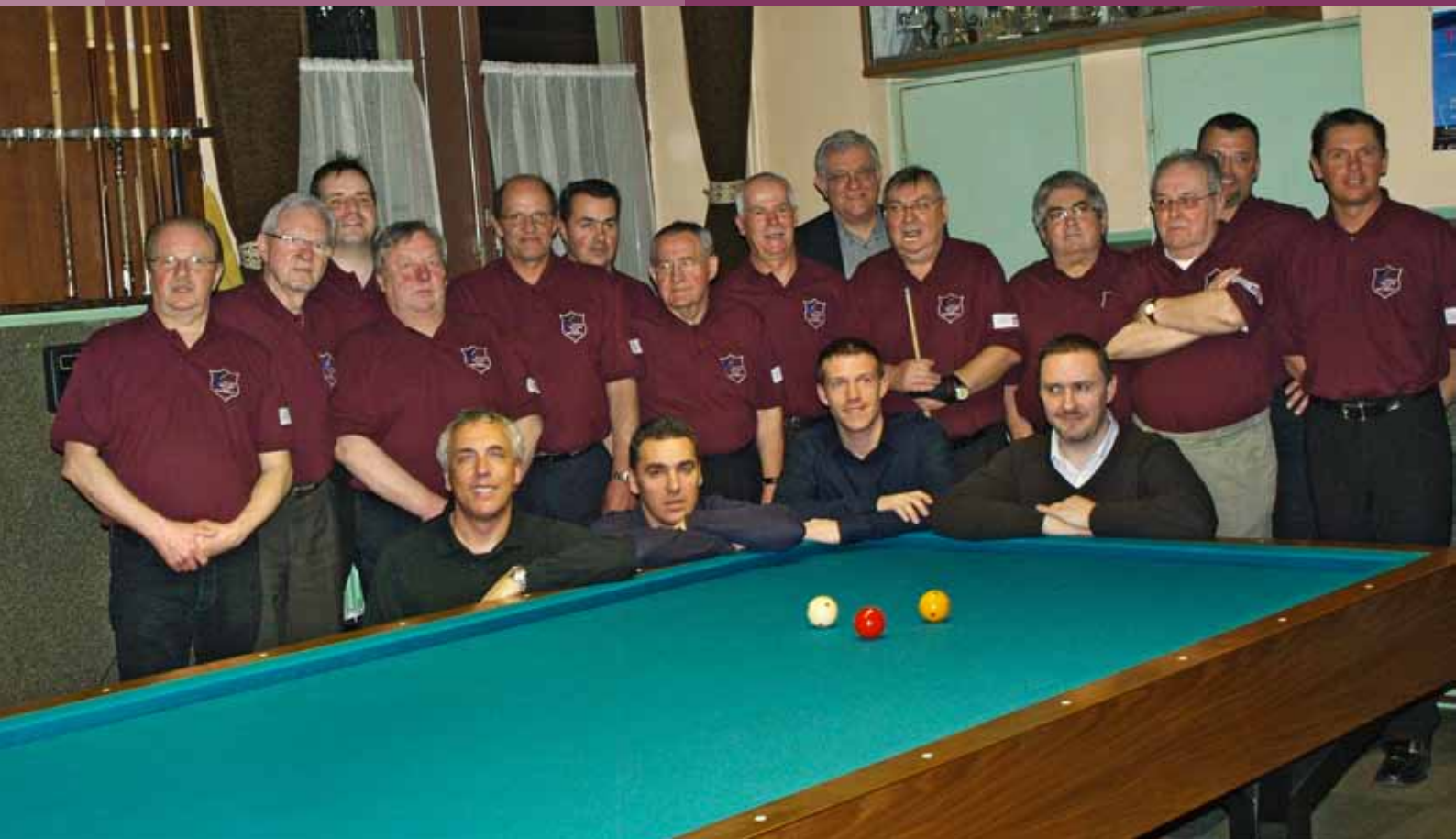
Les membres du Billard Club se sont fait une joie de recevoir l'équipe d'AGIPI, championne d'Europe en titre.