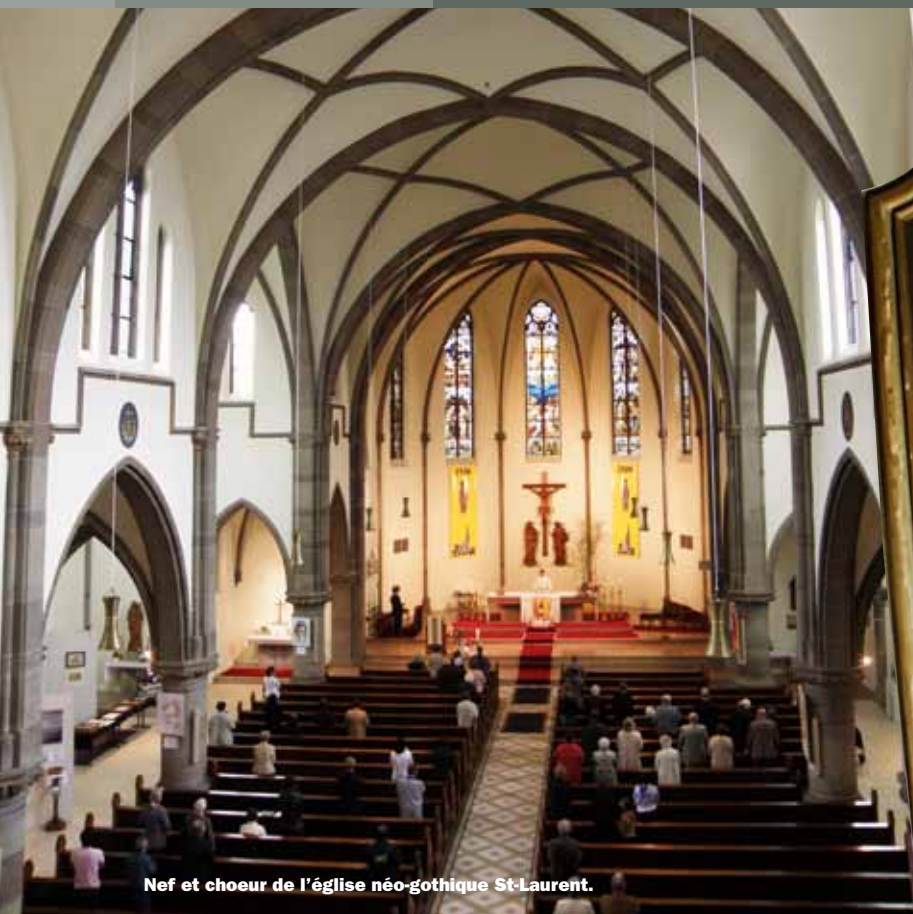
Nef et chœur de l'église néo-gothique St-Laurent.