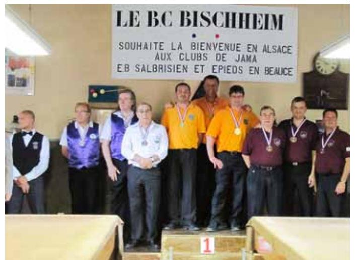
Les Bischheimois (sur le podium à droite) se sont classés 3e au Championnat de France jeu de série Division 4.

En raison d'un classement favorable, le B.C.B. a eu le privilège d'organiser cette finale les 29 et 30 mai. Et lorsque le délégué de la Fédération Française de