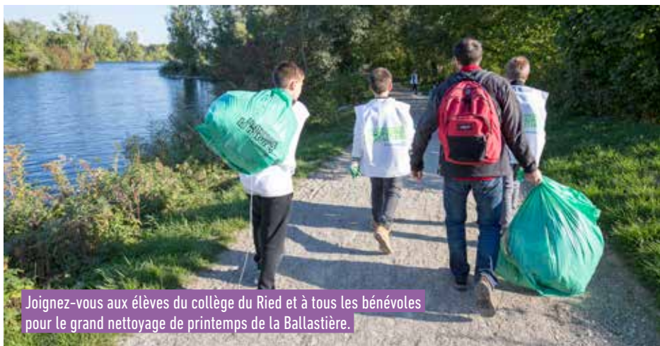
Joignez-vous aux élèves du collège du Ried et à tous les bénévoles pour le grand nettoyage de printemps de la Ballastière.

Le plan d'eau de la Ballastière est l'espace naturel le plus important de Bischheim et le plus apprécié des habitants. Il fait l'objet de deux opérations annuelles de nettoyage, l'une organisée par la ville au printemps et le second par les bénévoles du CAMNS qui n'hésitent pas à plonger pour en retirer toutes sortes de déchets nuisibles à la faune et la flore.