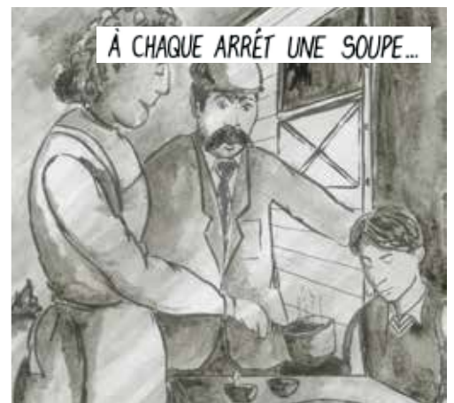
À CHAQUE ARRÊT UNE SOUPE...