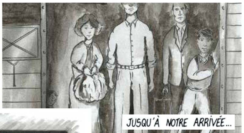
JUSQU'À NOTRE ARRIVÉE...