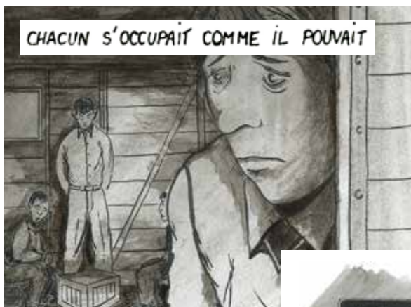
CHACUN S'OCCUPAIT COMME IL POUVAIT