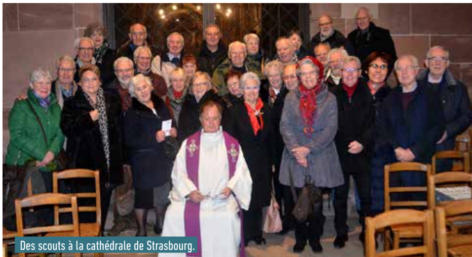
Des scouts à la cathédrale de Strasbourg.

S'il n'existe plus de mouvement de scouts à Bischheim, deux groupes d'anciens se réunissent encore pour partager des sorties conviviales.