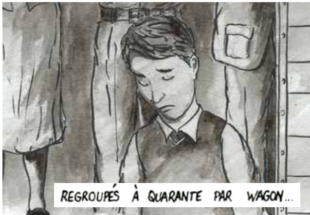
REGROUPÉS À QUARANTE PAR WAGON...