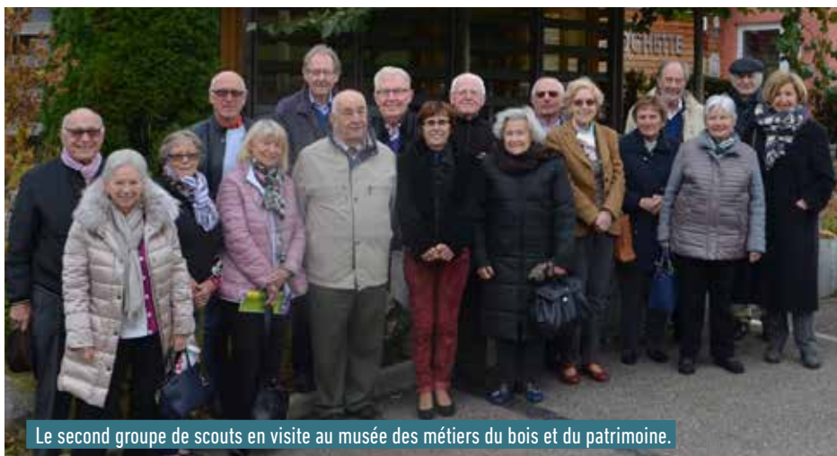
Le second groupe de scouts en visite au musée des métiers du bois et du patrimoine.

Le premier groupe de scouts réunit ceux qui faisaient partie du mouvement à sa création en 1946, et les « plus jeunes » ont fait partie du mouvement vers les années 1960, certains faisant la liaison entre les deux groupes.