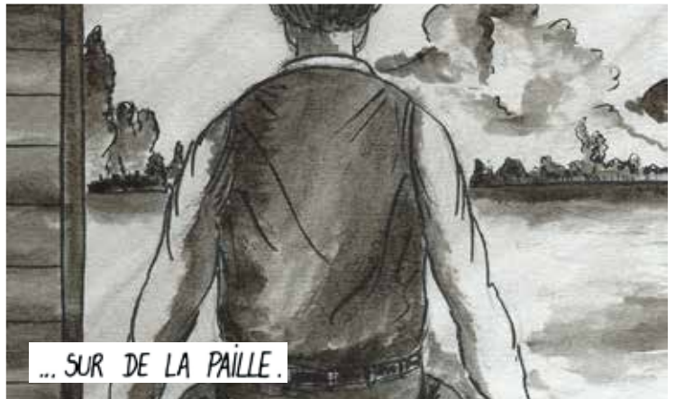
... SUR DE LA PAILLE.