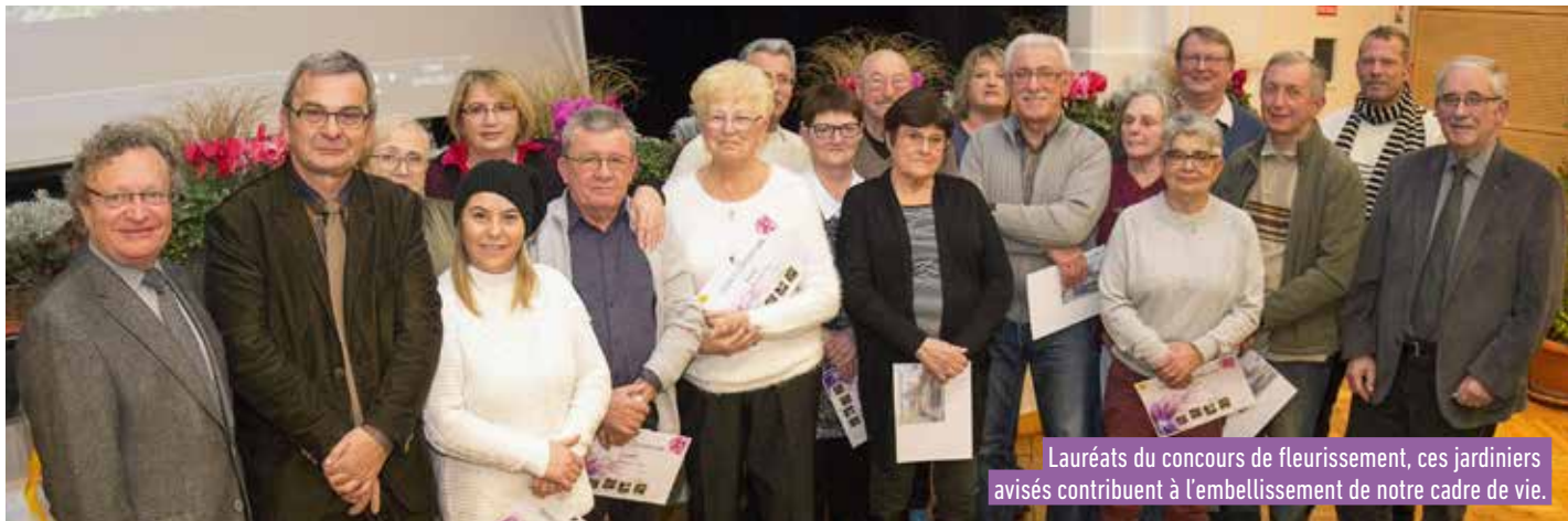
Lauréats du concours de fleurissement, ces jardiniers avisés contribuent à l'embellissement de notre cadre de vie.