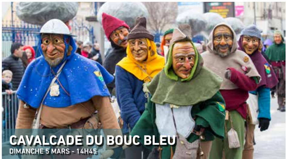
CAVALCADE DU BOUC BLEU DIMANCHE 5 MARS - 14H45

20 H • LE PRINTEMPS DE LA CLARINETTE Entrée libre Église protestante