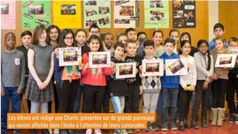
Les élèves ont rédigé une Charte, présentée sur de grands panneaux qui seront affichés dans l'école à l'attention de leurs camarades.