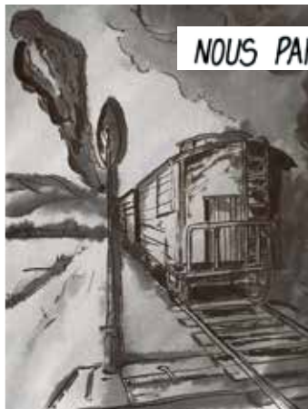
NOUS PARTIONS VERS UN ENDROIT INCONNU...