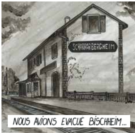
NOUS AVIONS EVACUÉ BISCHHEIM...