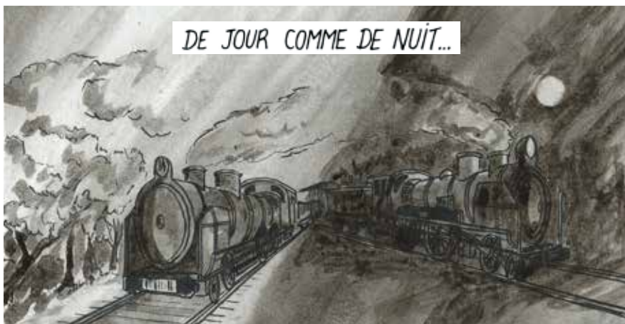
DE JOUR COMME DE NUIT...